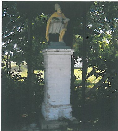
Socha svätého Urbana

Socha sa nachádza pri rieke Nitra, v blízkosti mosta.