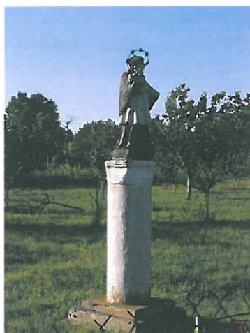
Socha svätého Jána Nepomuckého