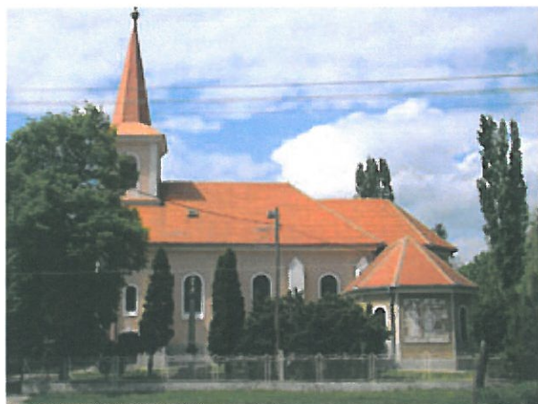
Rímskokatolícky kostol z r.1892