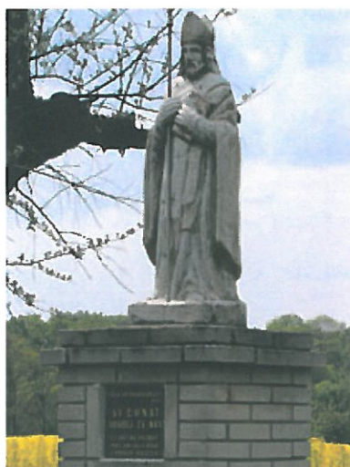
Socha svätého Donáta