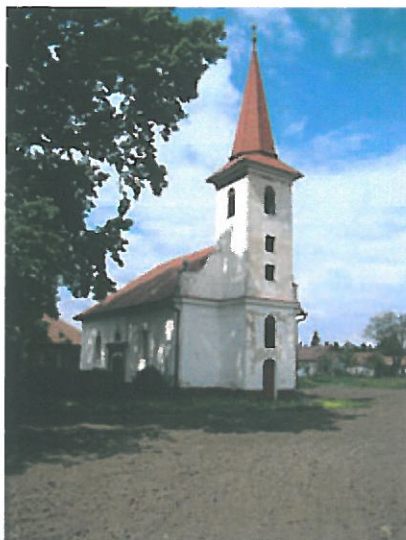
Kostol reformovanej kresťanskej cirkvi

Počiatky stavebného vývoja kostola Reformovanej kresťanskej cirkvi, ľudovo nazývanej kalvínskej, siahajú do roku 1790. Počas svojej existencie bol prestavaný, predovšetkým však v roku 1876, kedy bola ku kostolu pristavaná veža. Exteriér kostola je členený lizénovým rámovaním.