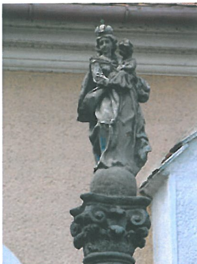
Mariánsky barokový stĺp