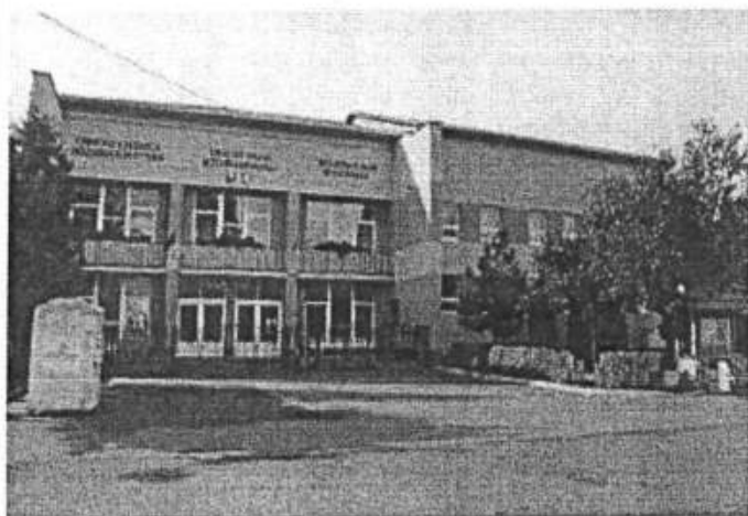
KOSTOL SV. ŠTEFANA KRÁĽA A KULTÚRNY DOM V BISKUPICIACH