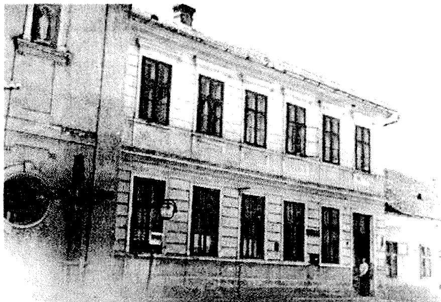
Budova kláštora sestier svätého Kríža v Pečeňadoch

Kláštor v Pečeňadoch spočiatku patril pod moravskú provinciu so sídlom v Choryni. Roku 1913 vznikla samostatná provincia pre maďarské územie v Žambéku, do ktorej pričlenili aj ústavy zo Slovenska. Slovenské sestry sa oddelili od maďarskej provincie po vzniku Česko-slovenskej republiky. Samostatná slovenská provincia sestier vznikla až roku 1927 a jej hlavným strediskom sa stal dom v Podunajských Biskupiciach.