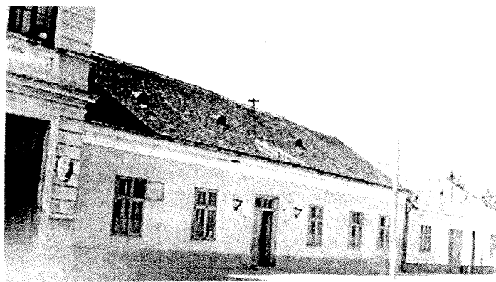
Budova školy v Pečeňadoch