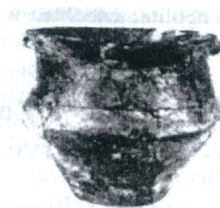
Keramika lengyelskej kultúry z Pečenadi

Úrodná sprašová rovina a dostatok vody vytvorili už v dávnej minulosti priaznivé podmienky pre osídlenie chotára dnešných Pečenadi. O tom, že obec vznikla na mieste dávneho osídlenia pri Váhu, svedčili príležitostné nálezy (hlinená nádoba, tri popolnice, ktoré sa našli pri kopaní základov domov). Údajne na rozhraní pečeňadského a kostolianskeho chotára sa nachádzalo päť či šesť vysokých kopcov zeme, ktoré sa každoročne znižovali. Predpokladalo sa, že ide o starobylé mohyly.