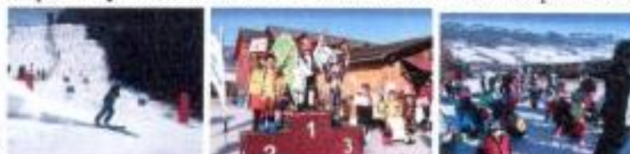
Horehronský Bučník 2018