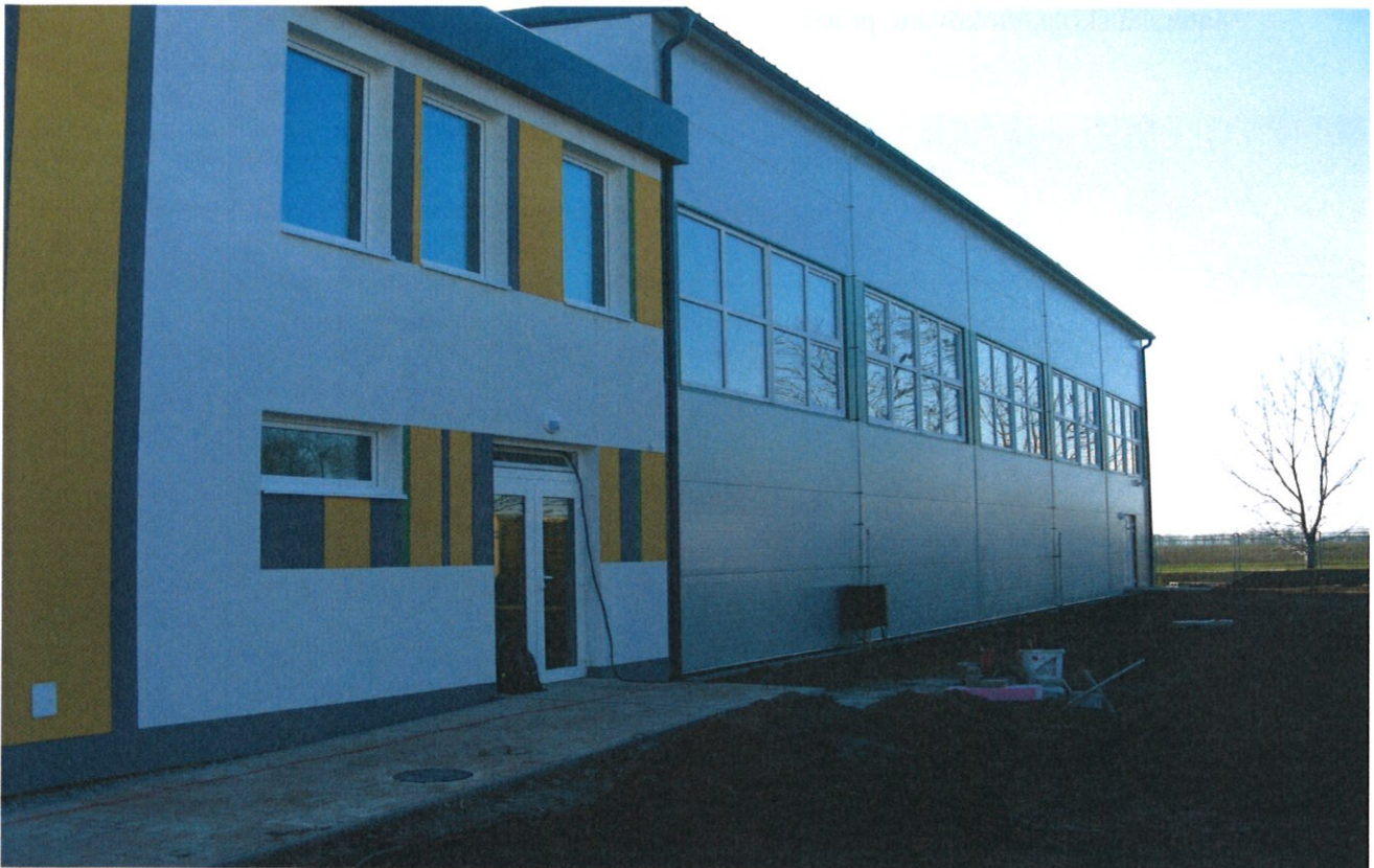
Pred základnou školou pribudlo nové parkovisko