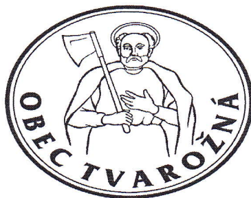
OBR. Č. 4: PEČAŤ OBCE TVAROŽNÁ

V pečati sa vyskytuje horná časť postavy svätého Mateja odetého v plášti, s gloriolou okolo hlavy, ako drží v pravej ruke sekeru opretú o plece.