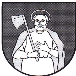
Obr. č. 2: Erb obce Tvarožná

Svätý Matej apoštol je patrónom farského rímskokatolíckeho kostola.