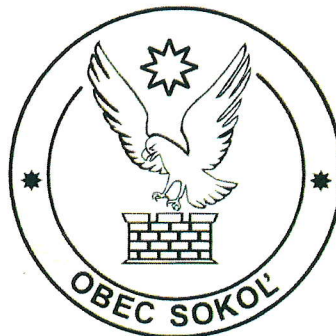
Obr. 2 Pečať Obce Sokol'

Pečať obce je okrúhla, uprostred s obecným symbolom a kruhopisom OBEC SOKOL'.