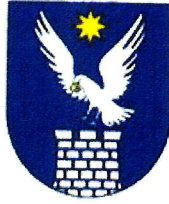
Obr. 1 Erb Obce Sokol'