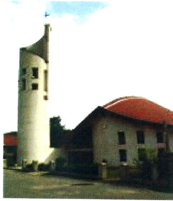
Obr. 5 Kostol Božského Srdca Ježišovho