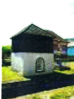
Obr. 4 Zvonica