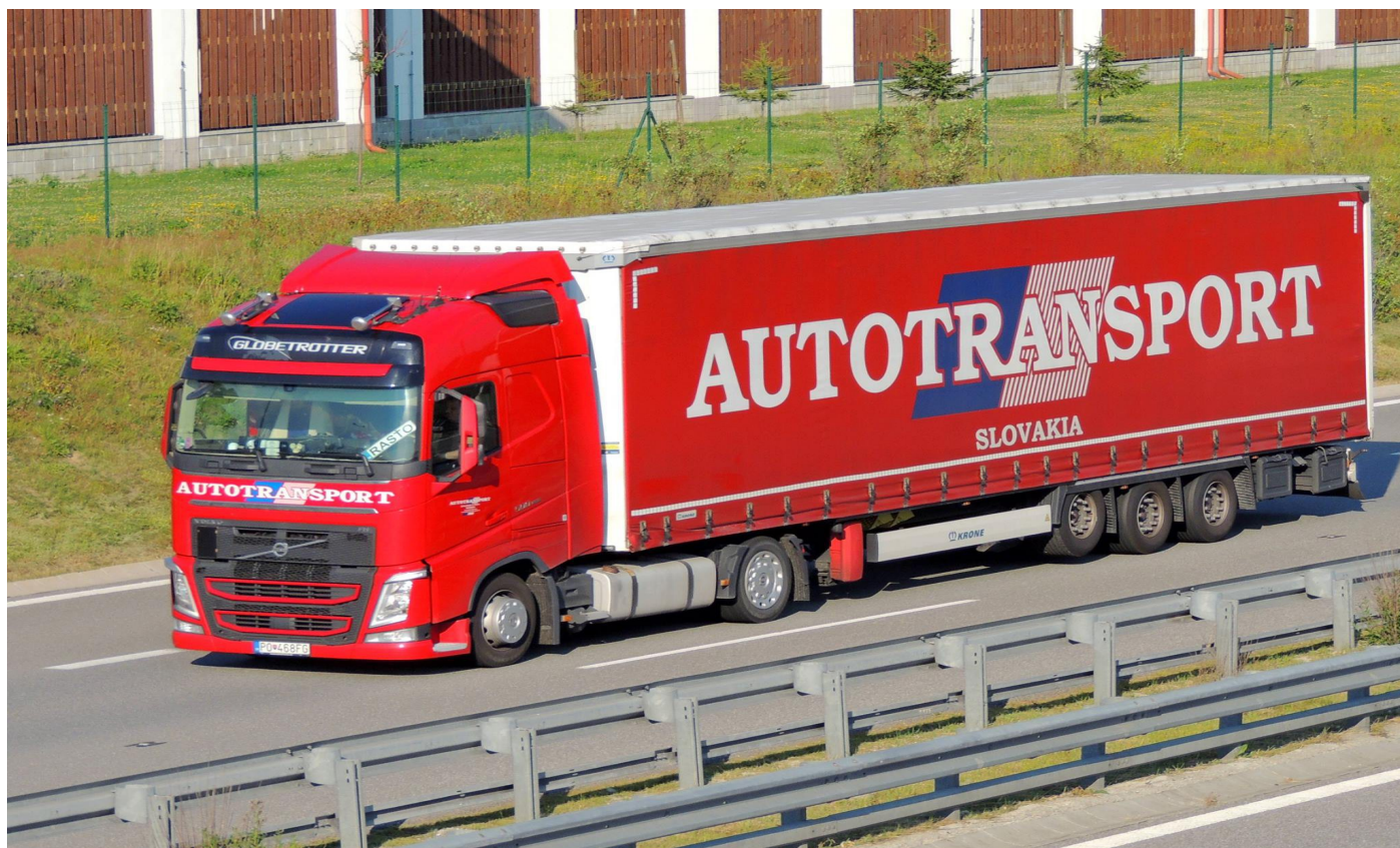
Obr. 4 Dizajn vozidiel prevádzkovaných spoločnosťou AUTOTRANSPORT, s.r.o.