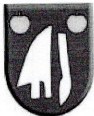
Erb obce :

Farby erbu a vlajky obce sú zelená, biela a žltá.