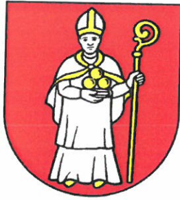
Obrázok 5 Erb obce Tomášov