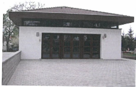
Obrázok 4 Kaplnka sv. Kríža

Pramene: http://www.pohrebnictvo.sk/dom-smutku-v-tomasove/