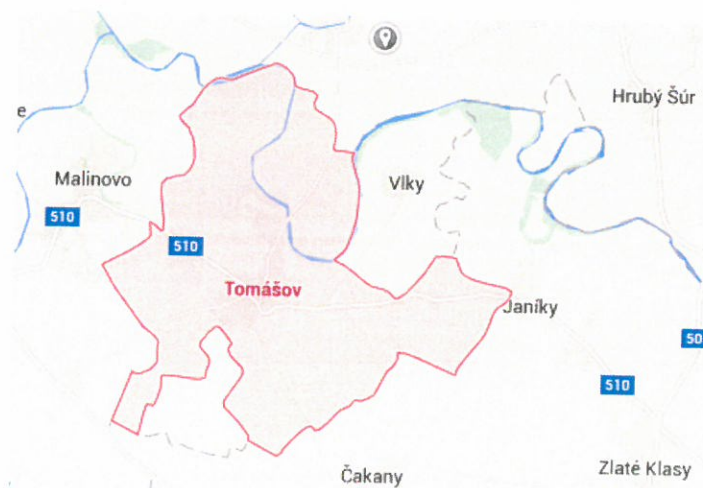
Obrázok 7 Geografická poloha obce Tomášov

Z hľadiska územno-správneho členenia patrí obec do okresu Senec a do Bratislavského samosprávneho kraja.