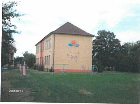
Obrázok 3 Budova pôvodnej ľudovej školy