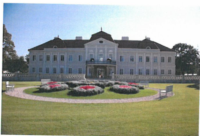
Obrázok 1 Barokový kaštieľ Majorháza

Za budovou barokového kaštieľa bol založený park na počesť kráľovnej Alžbety nazývaný ako Alžbetina záhrada. Ide o rozsiahly a pomerne dobre zachovaný anglický park.