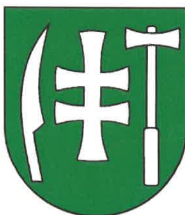
ERB OBCE BRZOTÍN

Vlajka obce: vlajka obce pozostáva zo siedmych pozdĺžnych pruhov, z ktorých šesť má rovnakú šírku, stredný pruh má dvojnásobnú šírku a je vo farbe bielej. Striedanie farieb zelená, biela, zelená, biela, zelená, biela a zelená. Má pomer strán 2:3 a ukončená je tromi cípmi t.j. dvomi zostrihmi, siahajúcimi do tretiny jej listu.