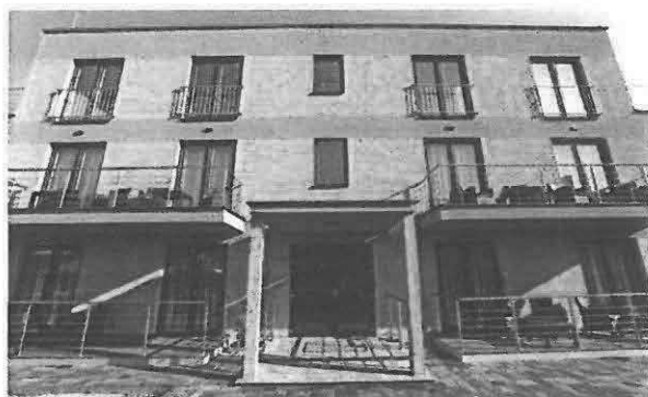
Penzión JUDAPA – Veľký Meder