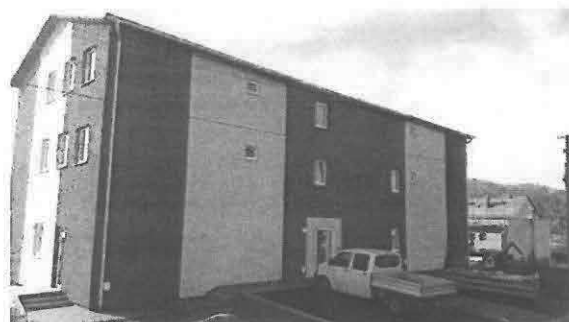
Prestavba internátu na bytový dom - Zvolen