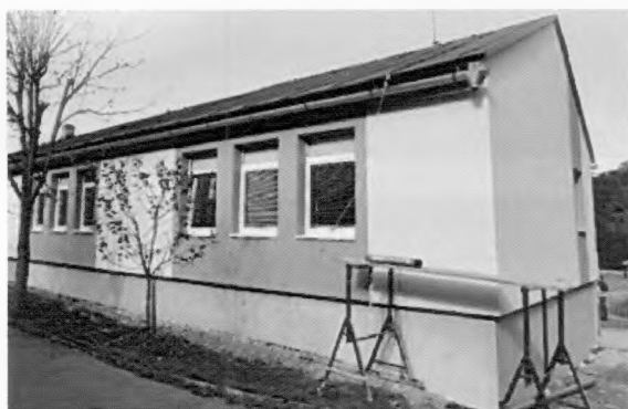
obnova fasády CVČ