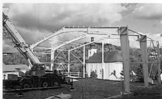
začiatok výstavby športovej haly v centre obce