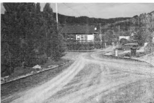
MK do Kultána