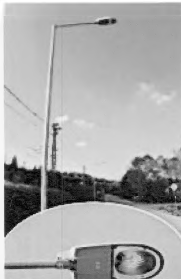
nové osvetlenie súružnej cesty