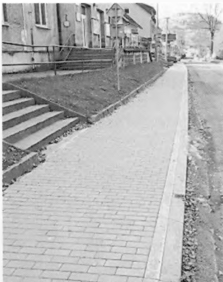
oprava chodníka v centre obce