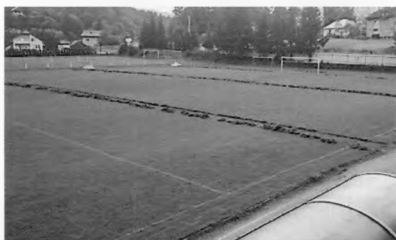
zavlažovací systém na futbalovom štadióne