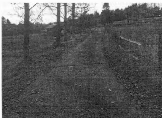
MK do Strakov