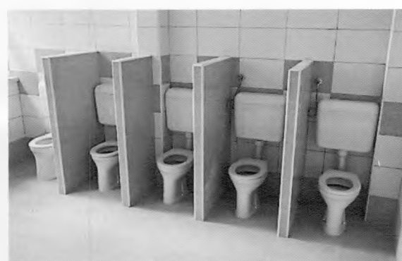
rekonštrukcia sociálnych zariadení v MŠ Ústredie