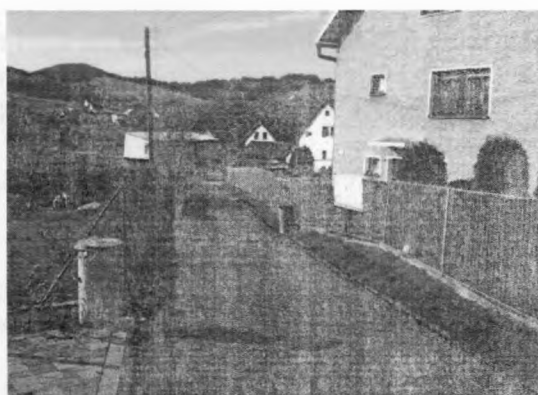
MK u Kreany