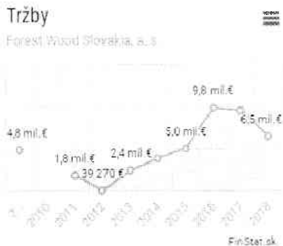
Graf. 2 Tržby