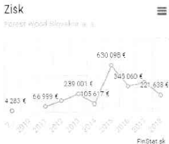
Graf. 1 Zisk