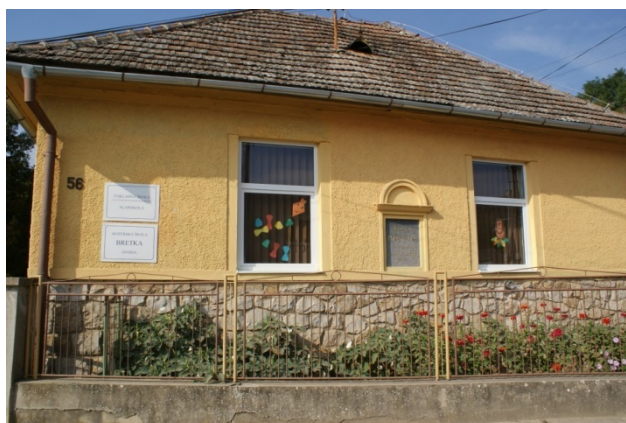
Budova školy a škôky

Na základe analýzy doterajšieho vývoja možno očakávať, že rozvoj vzdelávania sa bude orientovať na skvalitňovanie