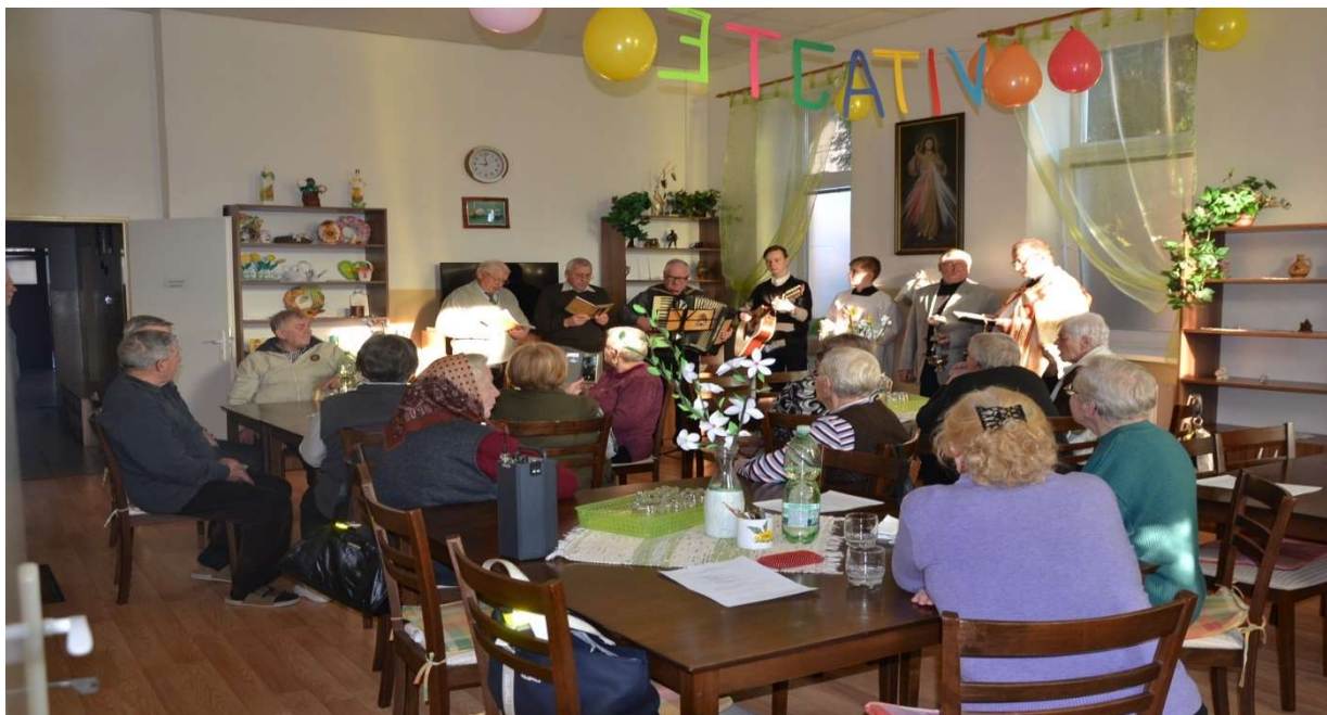
Otvorenie denného centra 2018.