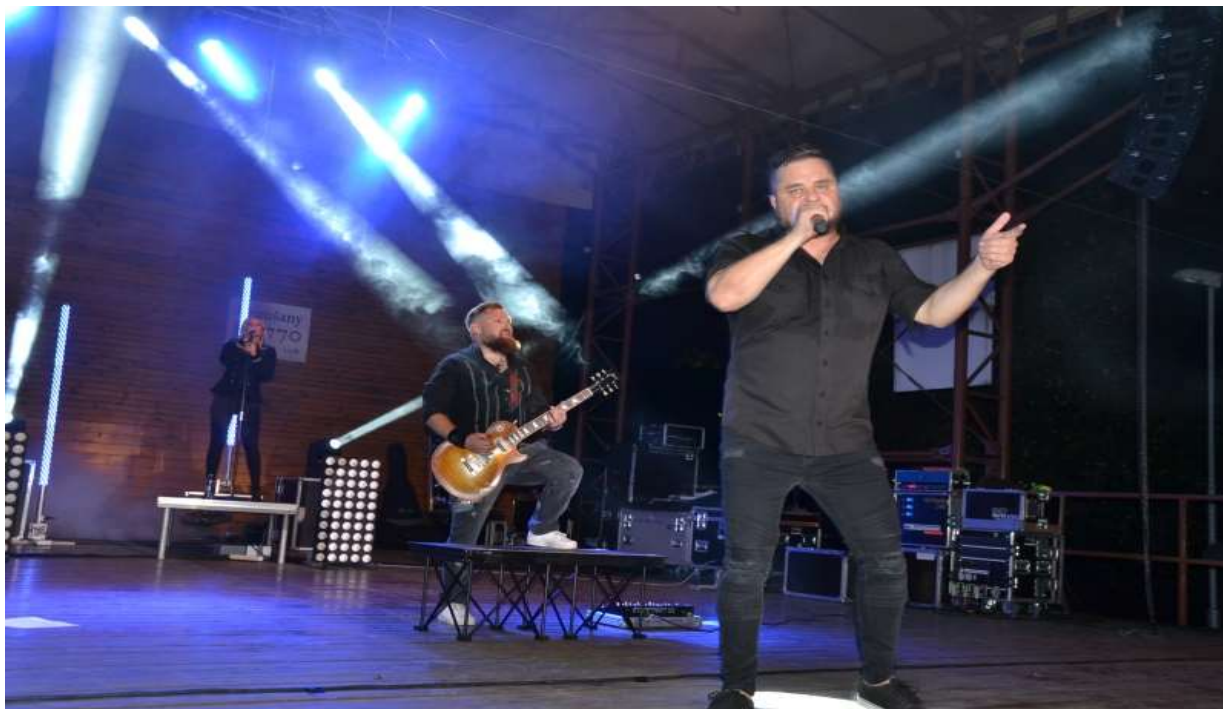
Vystúpenie skupiny Desmod

Hradné leto sme ukončili 25.8.2018 na hrade už tradičným podujatím Návrat rytierov na hrad Kapušany. Spoločné dobýjanie hradnej brány pripravili šermiari zo skupiny Sarus, Aramis, o.z. Akadémia bojových umení z Lipian, Strážcovia pravých pokladov storočí.