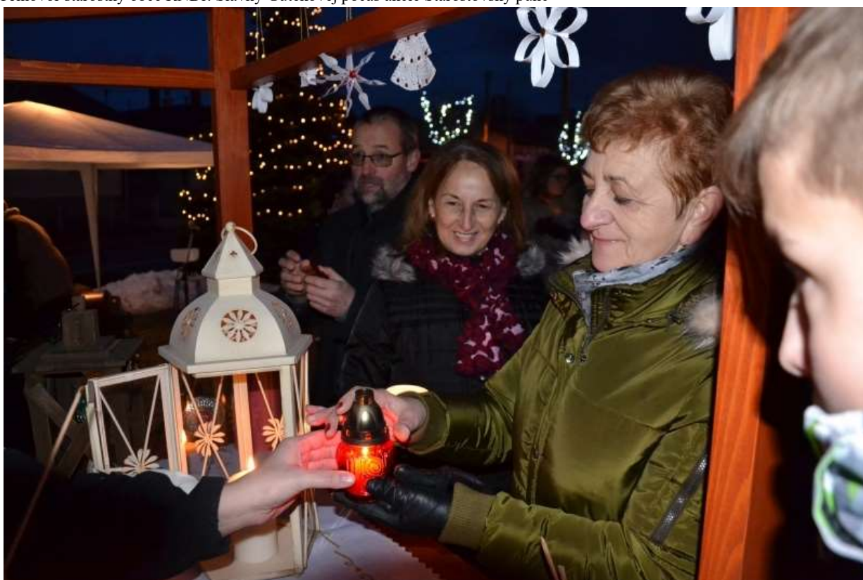
Akcia Starostovský punč- rozdávanie Betlehemskeho svetla

Počas vianočných sviatkov kapušianske deti a mládež chodievajú po koledovaní v rámci koledníckej akcie s názvom Dobrá novina , ktorá je spojená so zbierkou pre projekty rozvojovej spolupráce v afrických krajinách a zároveň programom rozvojového vzdelávania počas celého roka.