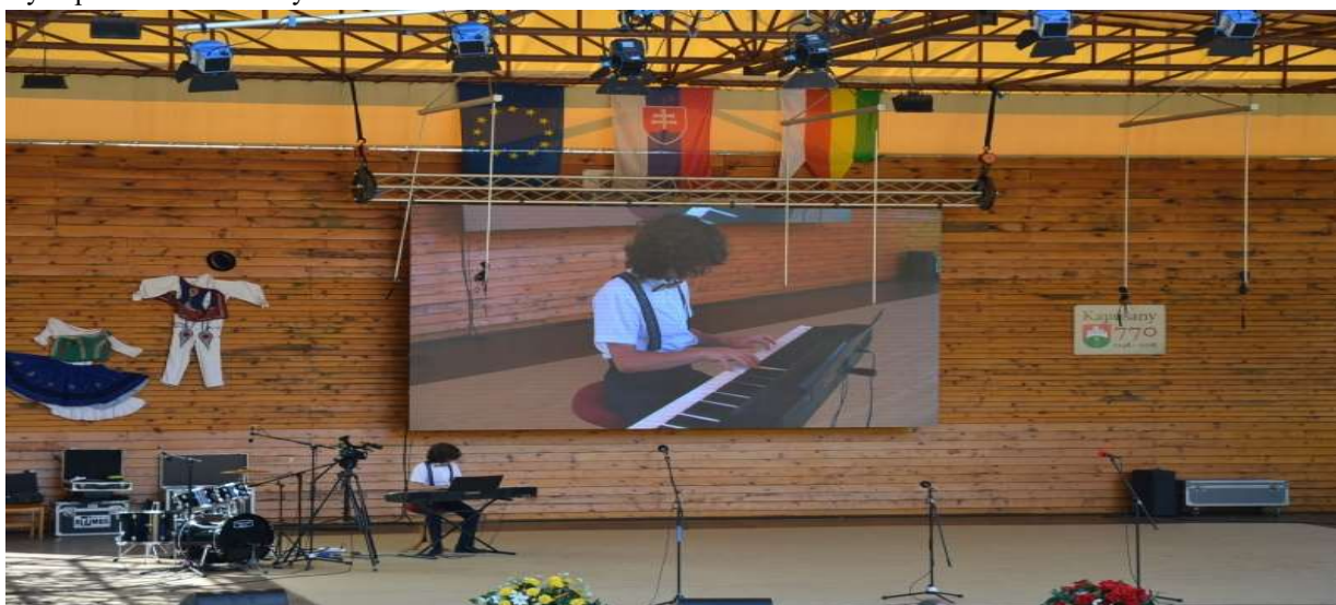
Vystúpenie Mladé talenty