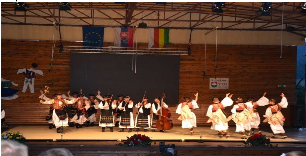
Vystúpenie umeleckého súboru Lúčnica