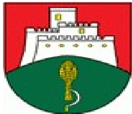
Erb obce :

Symboly obce tvoria pečať, vlajka, erb a obecné insígnie. Obec Kapušany má pečať okrúhlu, ktorú tvorí erb obce a názov obce s hrubopisom OBEC KAPUŠANY , erb obce Kapušany je tvorený kapušianskym hradom v červenom poli a pod ním je zväzok klasov v zelenom poli. Zástava vychádza z farieb obecného erbu a pozostáva z farieb biela, červená, žltá a zelená.