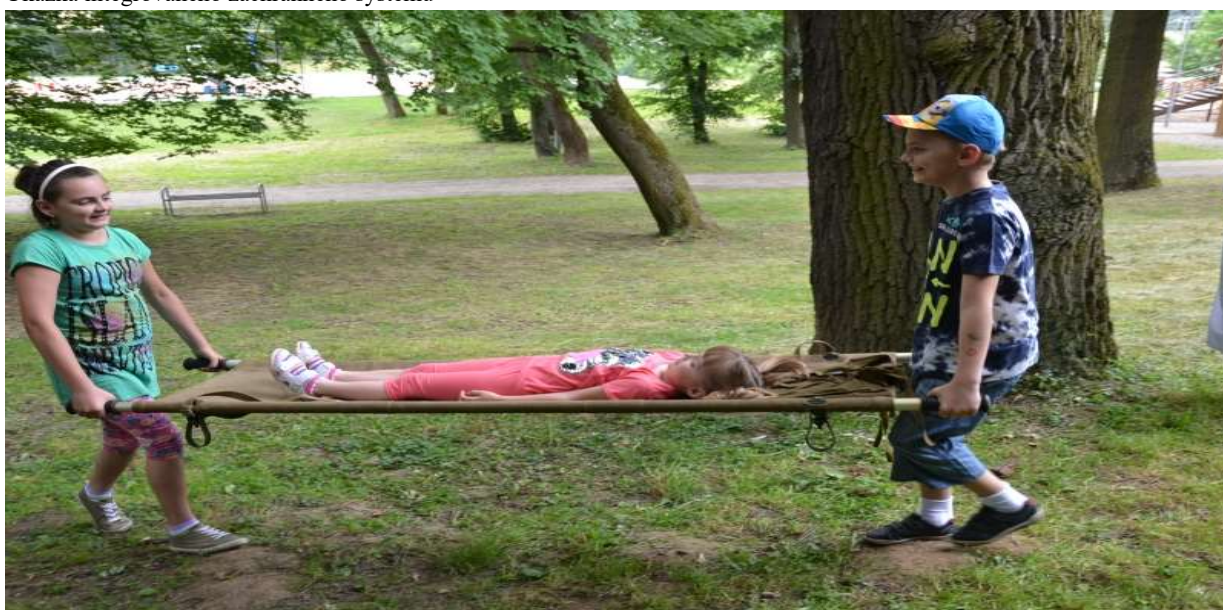
Ukážka mladých zdravotníkov