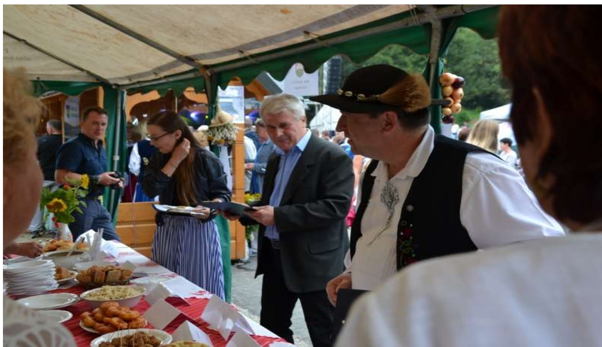
Súťaž vo varení jedál v partnerskej obci rok 2018

Počas roka vyvíjajú aktivity na podporu pravidelného darcovstva krvi členky Miestneho spolku Slovenského Červeného kríža . Okrem uvedenej aktivity realizujú burzu šatstva a zabezpečujú vitamínové balíčky pre občanov nad 85 rokov.