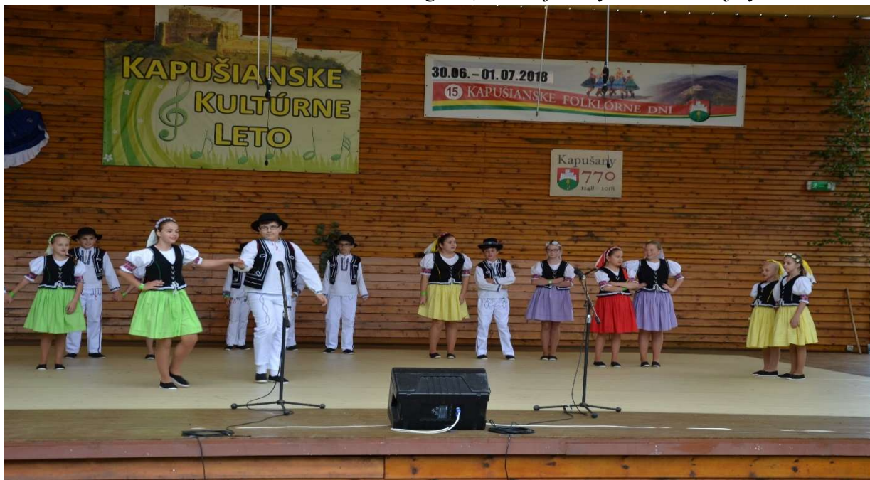
Kapušíanske folklórne dni 2018 - Vystúpenie DFS Čerešenka

Obec Kapušany organizuje každoročne Kapušíanske folklórne dni , ktoré sú nesúťažnou prehliadkou uchovávaní tradícií nielen zo šarišského regiónu, ale aj z iných častí krajiny i zahraničia.