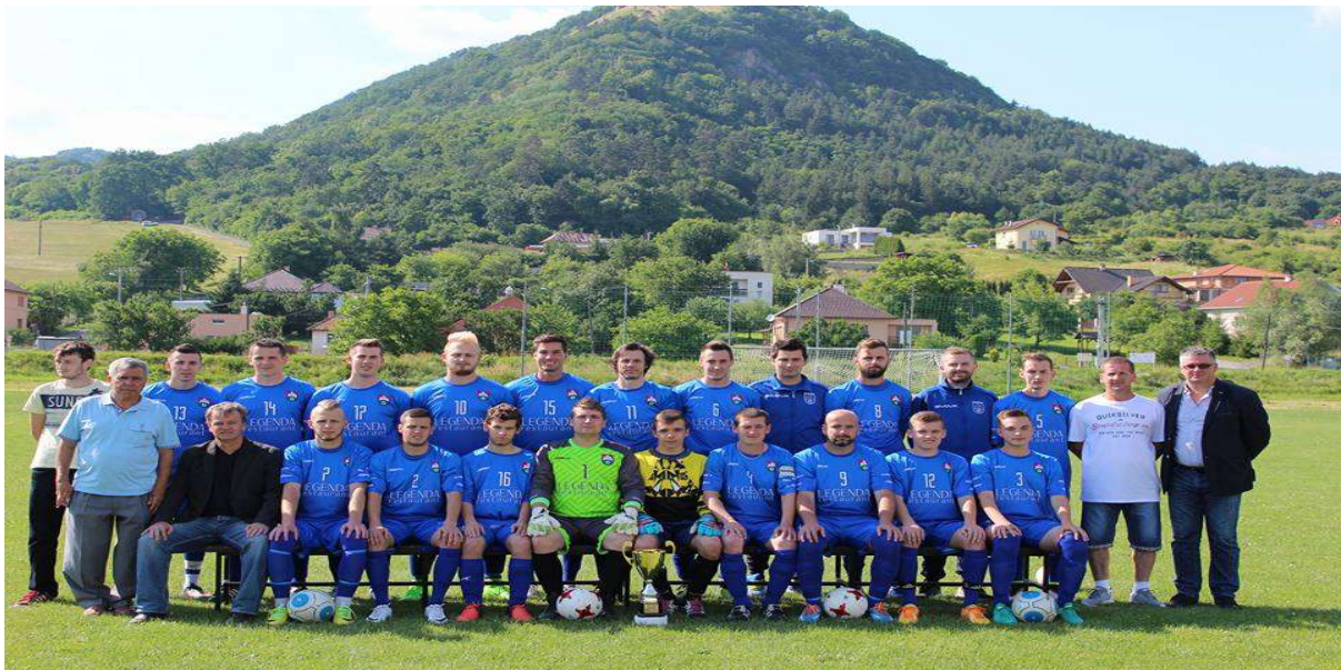
A mužstvo OŠK Kapušany