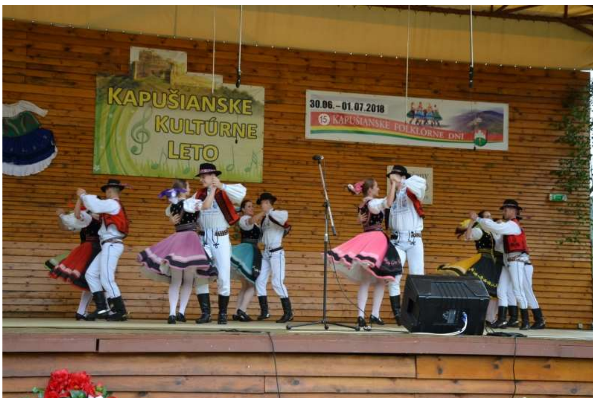
Kapušíanske folklórne dni 2018 - Vystúpenie FS Dúbrava