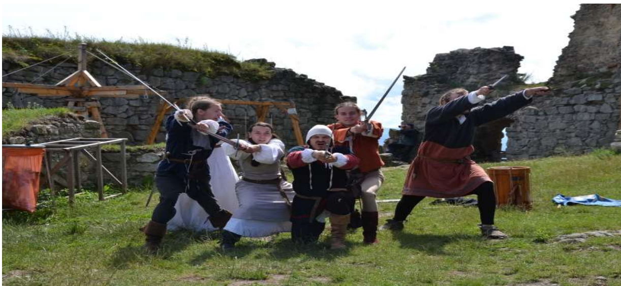
Otvorenie hradného leta na Kapušianskom hrade