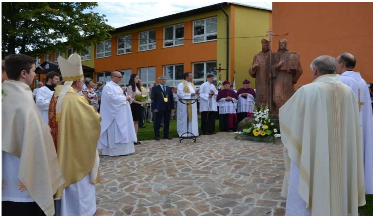
Posviacka súsošia sv. Cyrila a Metoda

Kapušíanske hradné leto sa uskutočnilo počas letných prázdnin na Kapušíanskom hrade. Dňa 24. júna 2018 sme hradné leto otvorili podujatím, na ktorom predviedli svoje umenie šarišskí šermiari SARUS, tanečnice historického a orientálneho tanca Fatima a herci divadla Na doske. Sprievodnými akciami boli tvorivé dielne pre deti, lukostreľba, Divadlo z kuchyne.