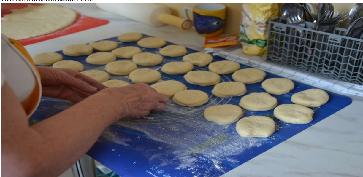
Denné centrum 2018. Pečenie šišiek