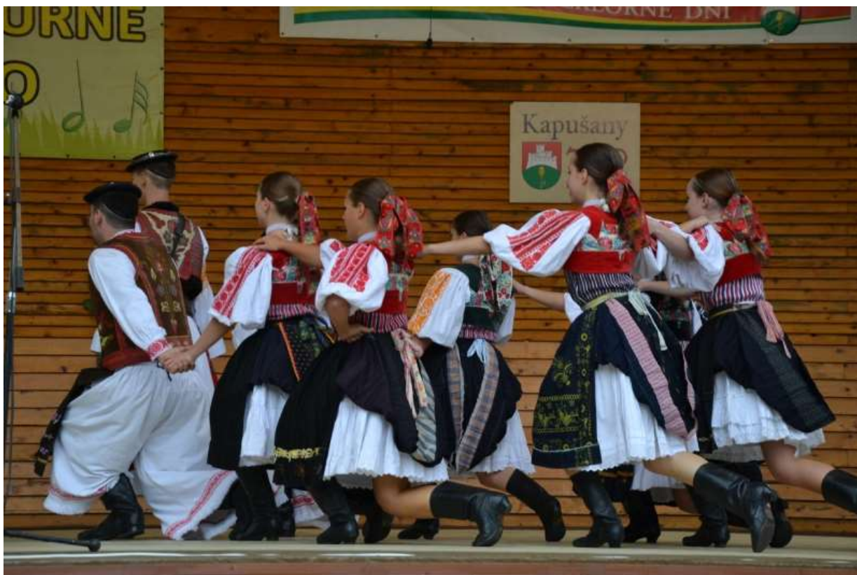
Kapušíanske folklórne dni 2018 - Vystúpenie FS Urpín