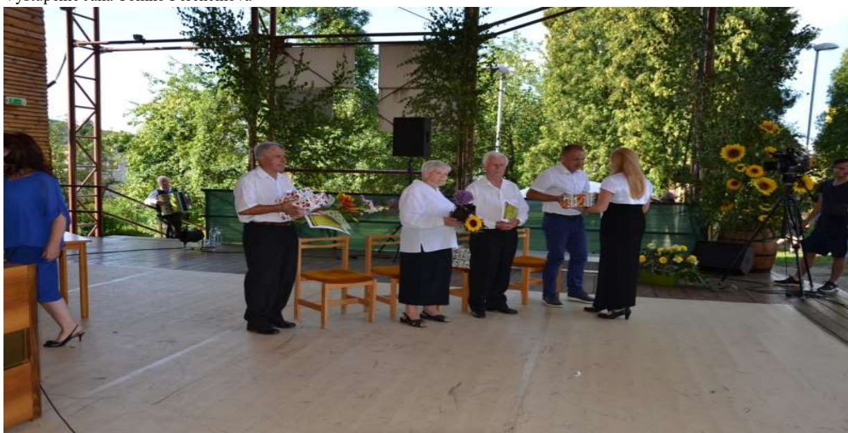
Udelenie Ceny obce Kapušany