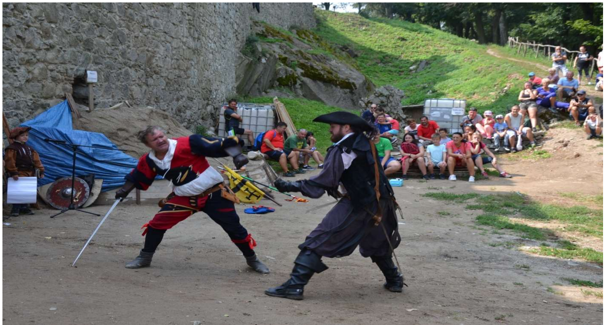
Návrat rytierov na hrad Kapušany