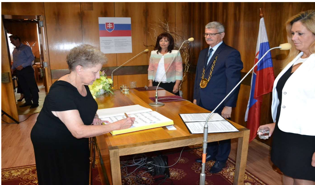
Čestné občianstvo obce