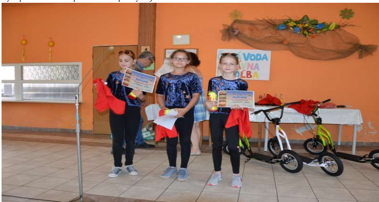
Ocenenie súťažiacich počas akcie Kapušany majú talent