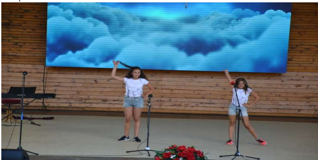
Vystúpenie Mladé talenty