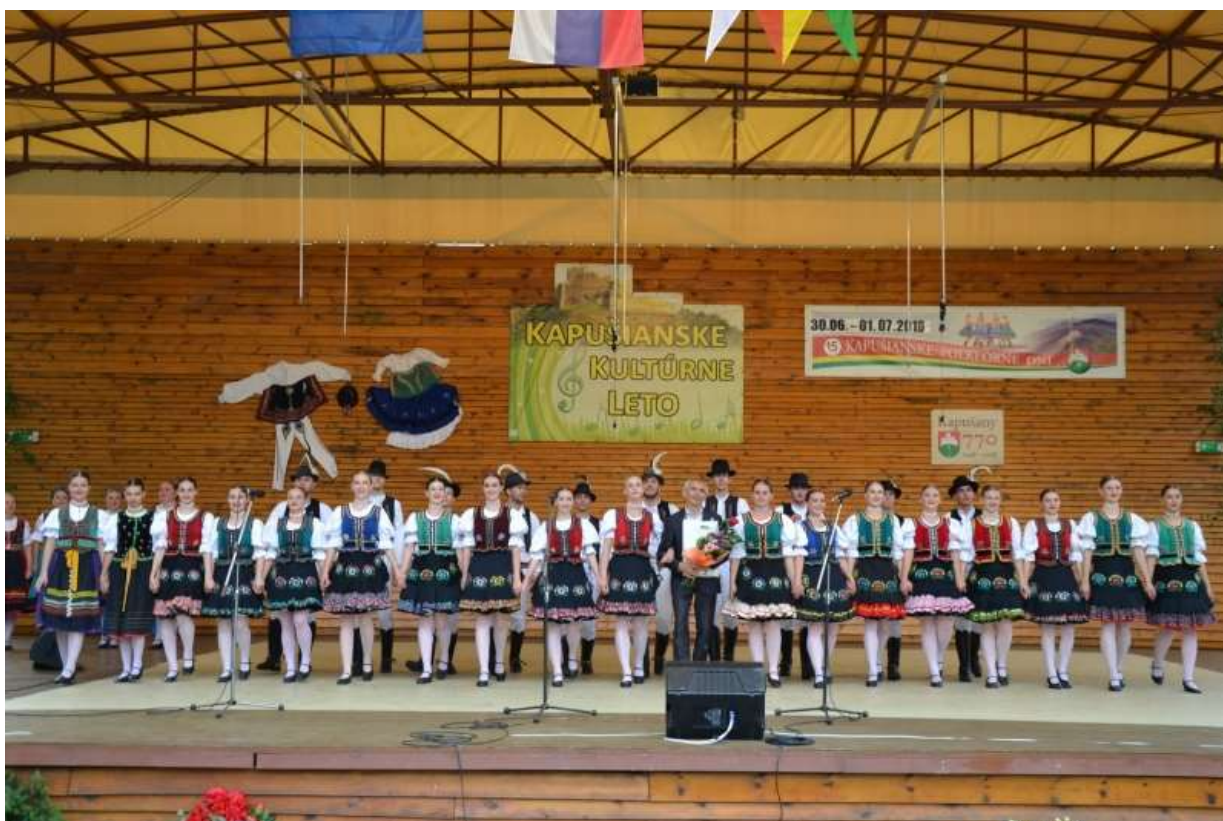
Kapušíanske folklórne dni 2018 - FS Železiar

Dňa 1.1.2018 obec otvorila denné centrum po zániku denného stacionára k 31.12.2017. Klienti denného centra si spríjemňujú pobyt rôznymi akciami, a to pečenie šišiek počas fašiangov, veľkonočná a vianočná burza a iné.