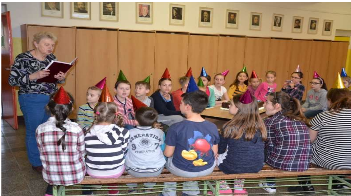
Deň ľudovej rozprávky 2017