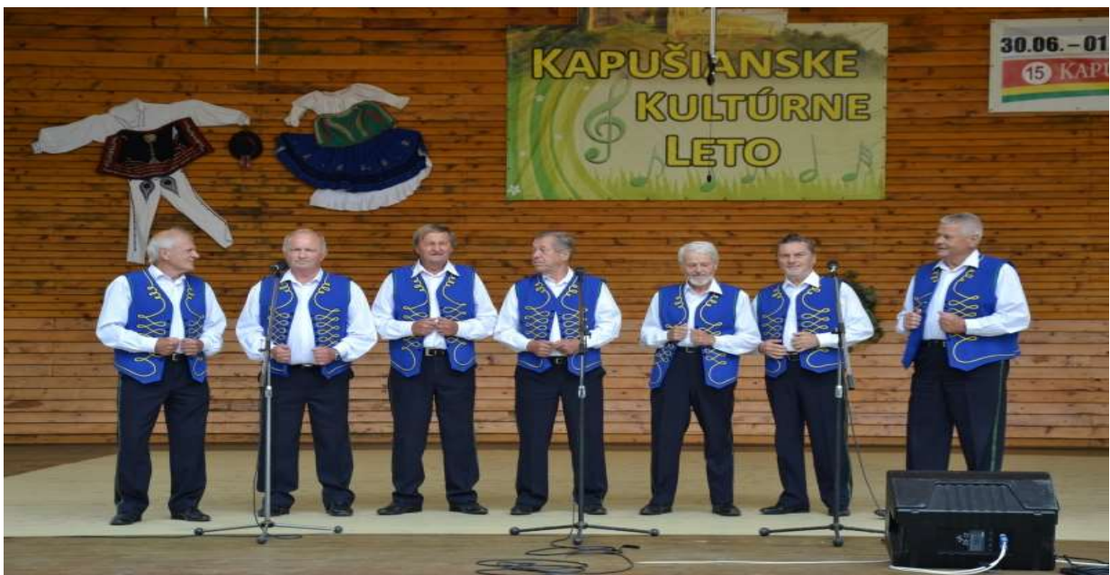
MSS Kapušianske richtaroše