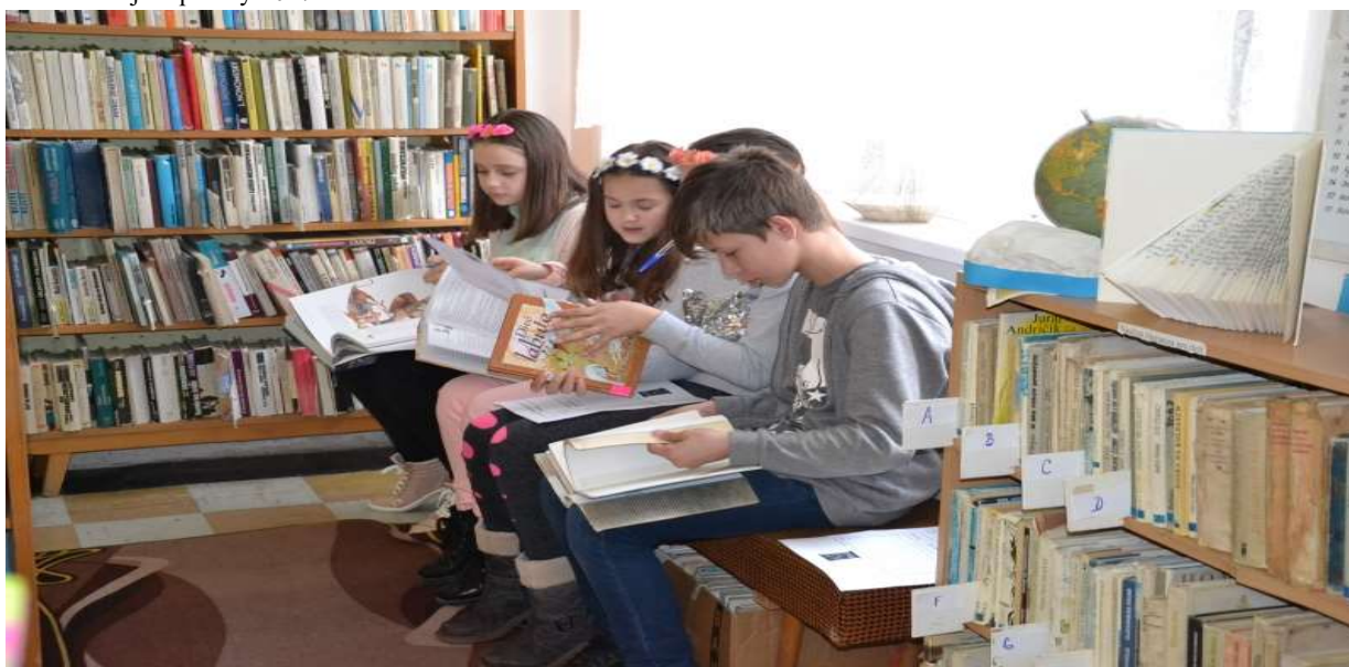
Deň ľudovej rozprávky 2017

Počas letných mesiacov obec pripravila viaceré kultúrne podujatia v rámci Kapušíanskeho kultúrneho leta . Prvou akciou bolo Stavanie mája , dňa 30. apríla vo večerných hodinách, kedy sa zišli obyvatelia obce so svojimi známymi, aby si v príjemnej atmosfére vychutnali postavenie obecného mája a spríjemnili si večer kultúrnym programom.