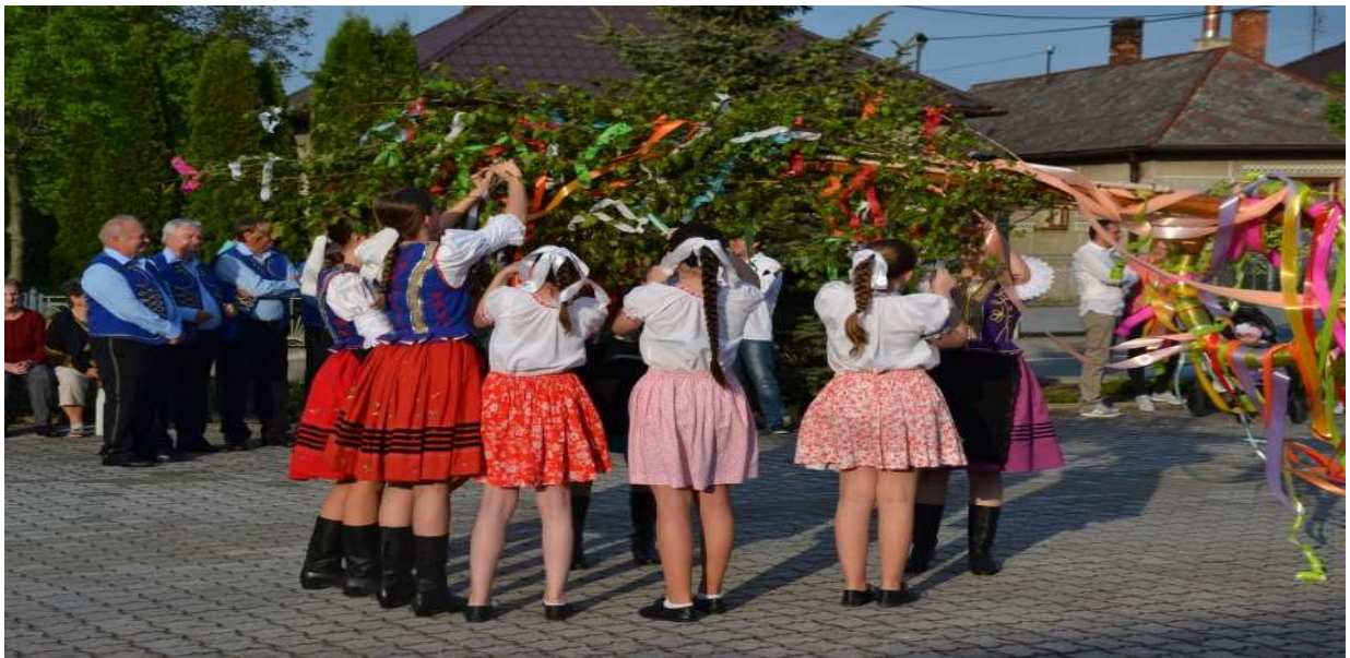
Stavanie mája pred kostolom sv. Martina