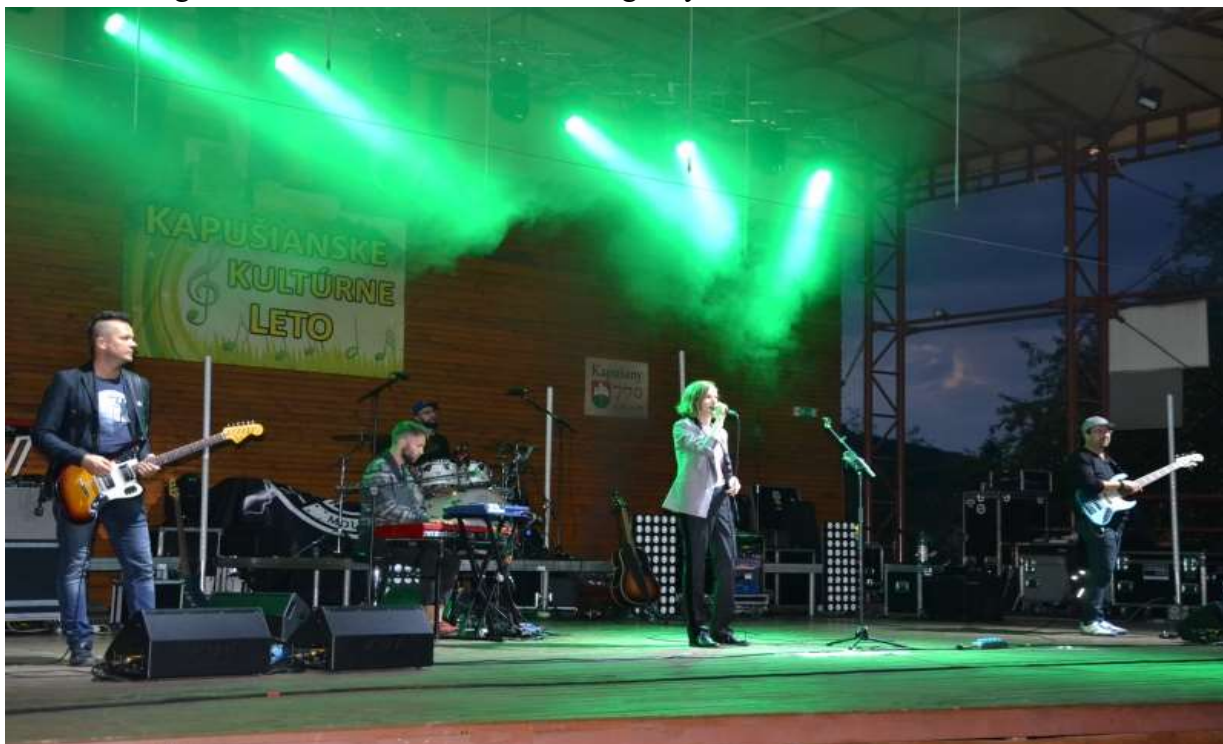
Vystúpenie Zuzany Smatanovej

Aj tento rok si obec Kapušany pre svojich obyvateľov pripravila podujatie v podobe veľkolepého koncertu jedných z najznámejších predstaviteľov slovenskej hudobnej scény. V utorok 28. augusta nám srdcia značne zahriali legendy Zuzana Smatanová a Kuli s Desmodom.