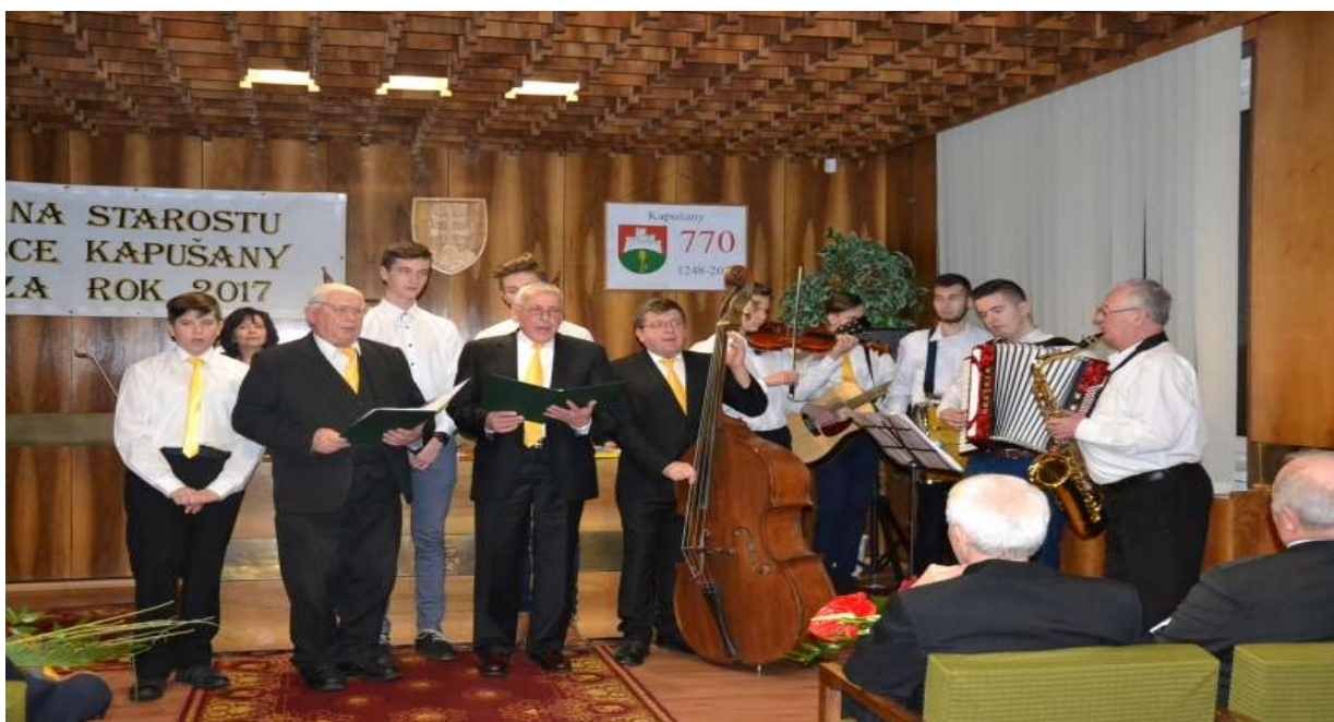
Vystúpenie skupiny Glória na udelení Ceny starostu obce za rok 2017

V nedeľu 11. marca 2018 počas pôstneho obdobia pripravil MS SČK v spolupráci s Obecným úradom, sociálnou komisiu a Rímskokatolíckou farnosťou Kapušany pôstnu polievku. Výťažok z tejto akcie bol pre 4 rodiny a 1 osamelú osobu z našej obce.