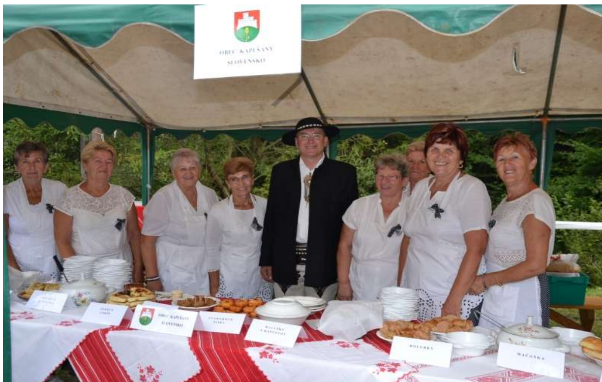
Súťaž vo varení jedál v partnerskej obci rok 2018