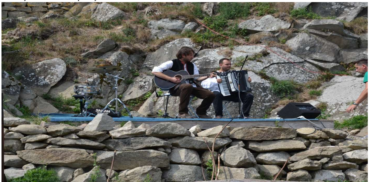
Návrat rytierov na hrad Kapušany