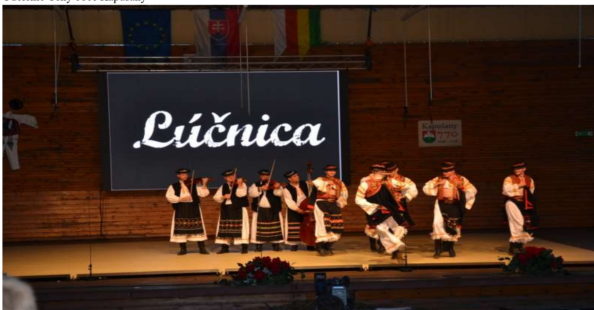
Vystúpenie umeleckého súboru Lúčnica