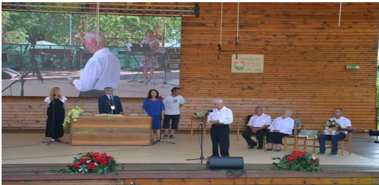
Udelenie Ceny obce Kapušany