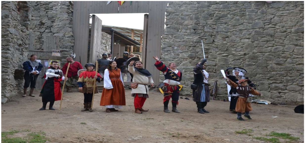
Návrat rytierov na hrad Kapušany