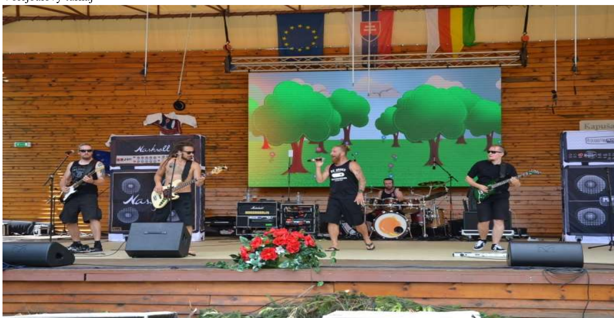
Vystúpenie skupiny Heľenine oči