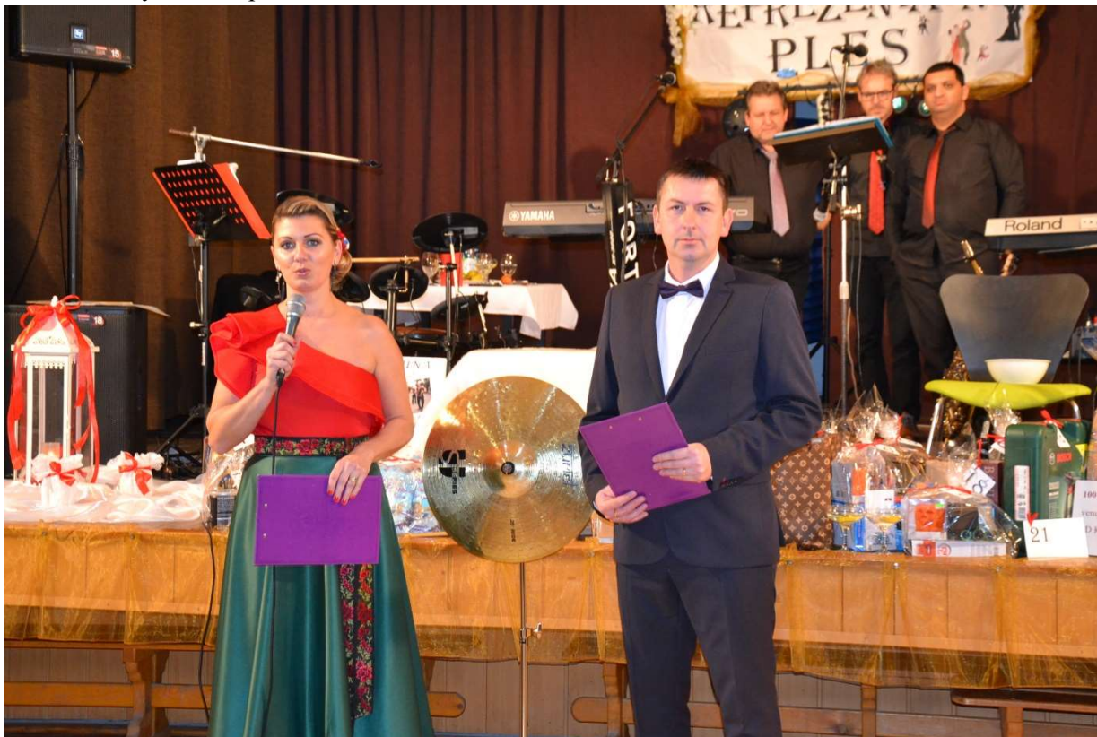
Reprezentačný ples obce Kapušany a Rady rodičov pri ZŠ s MŠ

Počas plesovej sezóny sa konal reprezentačný ples, ktorého organizátorom bol obecný úrad spolu s členmi Rady rodičov pri ZŠ s MŠ.