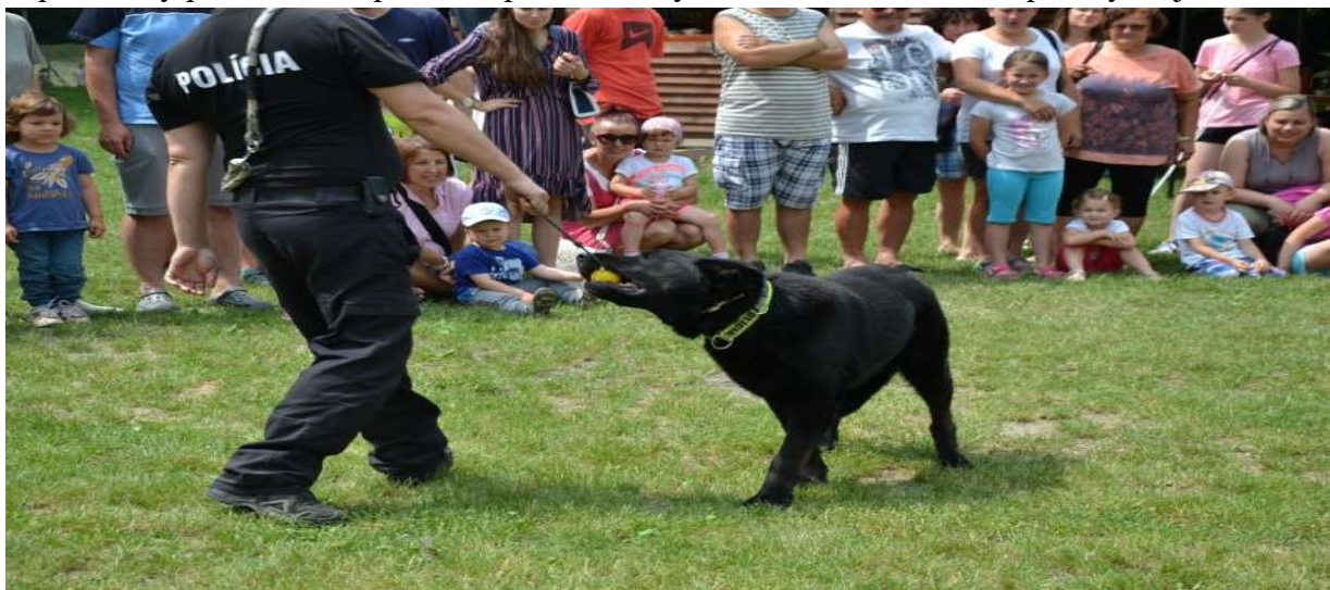
Ukážka integrovaného záchranného systému

a vojaci plnili úlohy s maximálnym nasadením. Za úspešné vykonanie zadania získali kapušiansky peniažtek. Popoludnie patrilo mladým umelcom v súťaži Kapušany majú talent.