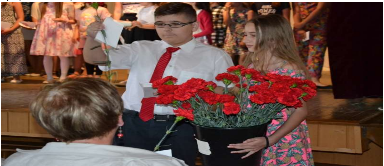
Odovzdávanie darčiekov pre mamičky

Dňa 2. júna 2018 počas akcie Deň detí v dopoludňajších hodinách sa Park sv. Cyrila a Metoda premenil na výcvikové stredisko integrovaného záchranného systému. Mladí zdravotníci, hasiči