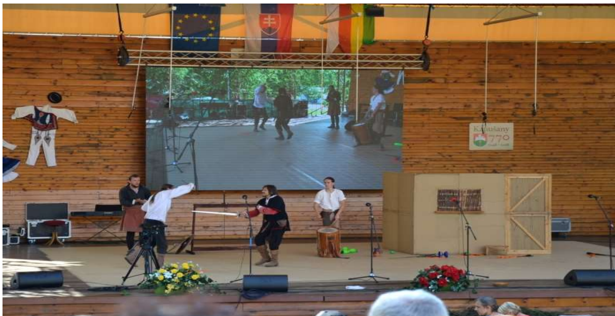
Vystúpenie Spolok šarišských šermiarov