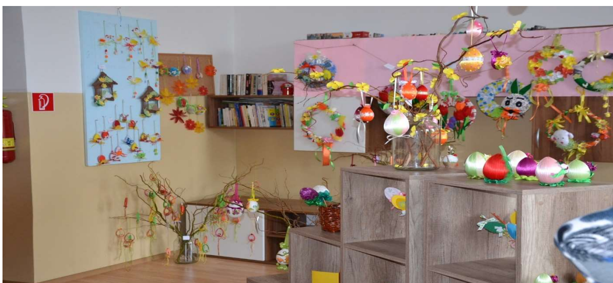
Veľkonočná burza v dennom stacionári