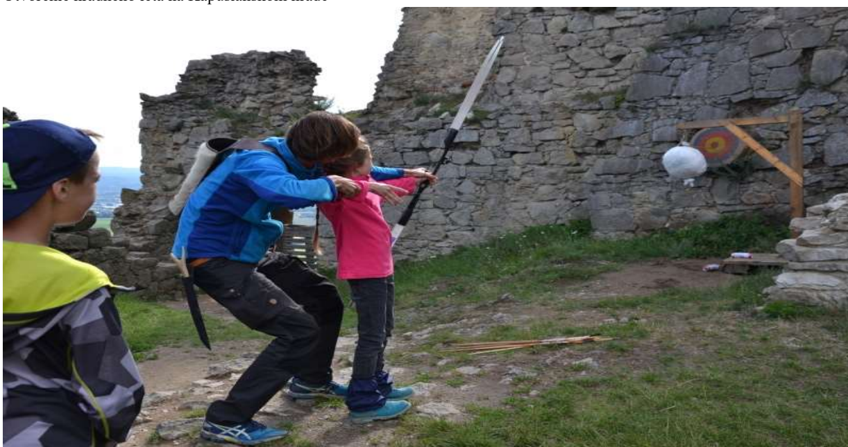
Otvorenie hradného leta na Kapušianskom hrade