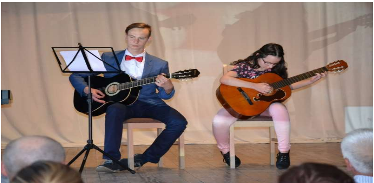
Vystúpenie detí SZUŠ počas dňa Matiek