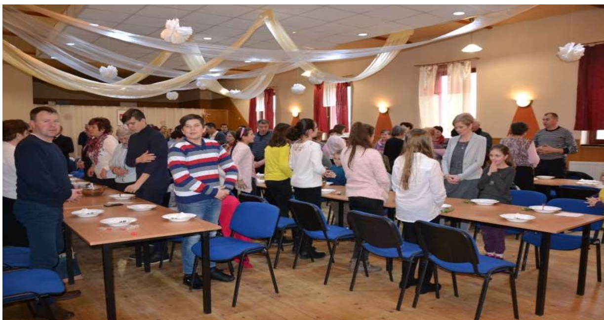
Pôstna polievka rok 2018

V nedeľu 11. marca 2018 počas pôstneho obdobia pripravil MS SČK v spolupráci s Obecným úradom, sociálnou komisiu a Rímskokatolíckou farnosťou Kapušany pôstnu polievku. Výťažok z tejto akcie bol pre 4 rodiny a 1 osamelú osobu z našej obce.