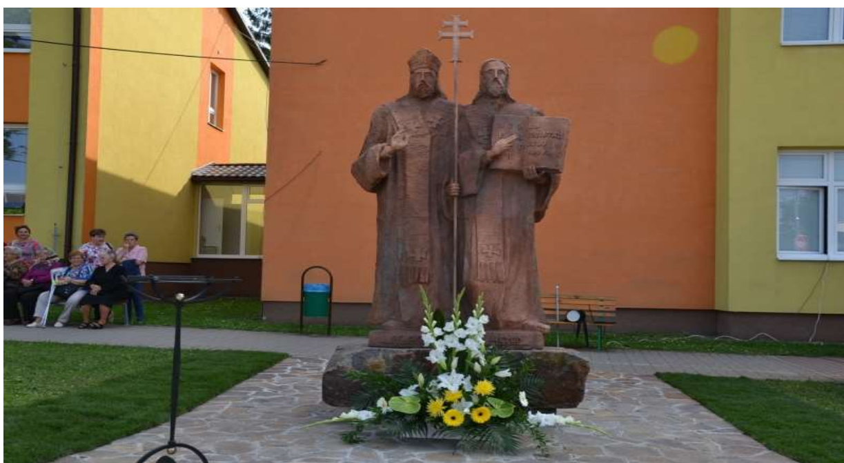
Súsošie sv. Cyrila a Metoda