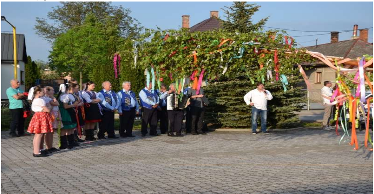
Stavanie mája pred kostolom sv. Martina