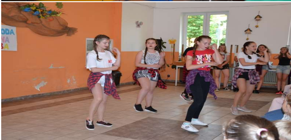
Vystúpenie súťažiacich počas akcie Kapušany majú talent