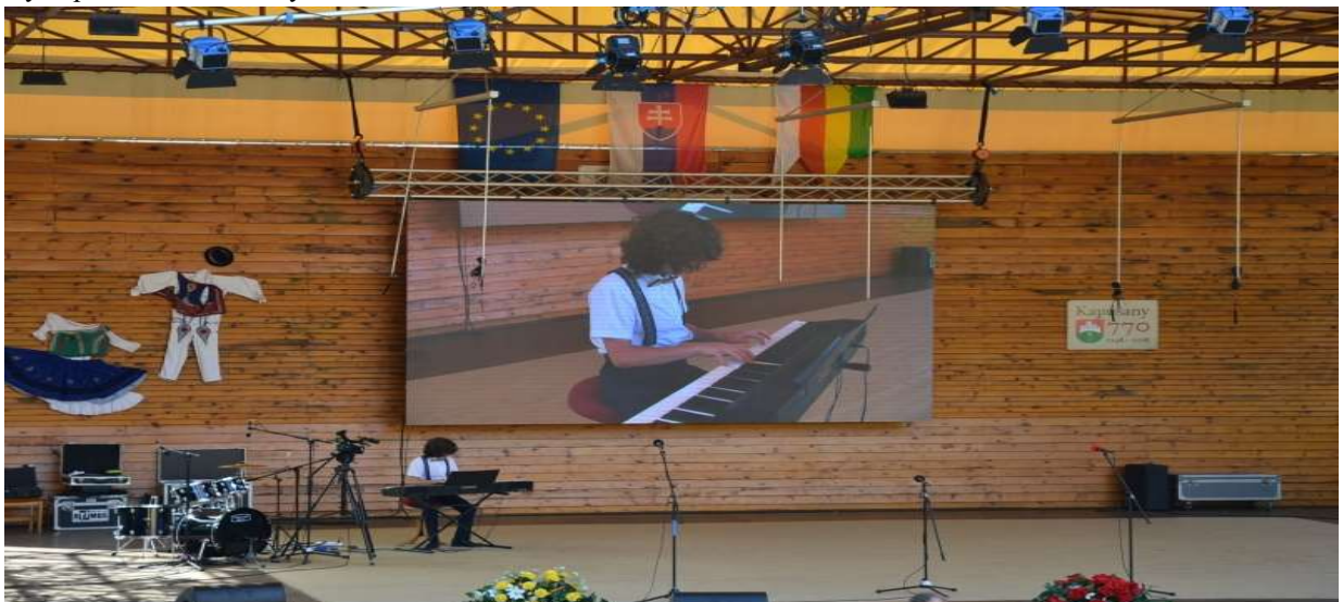
Vystúpenie Mladé talenty