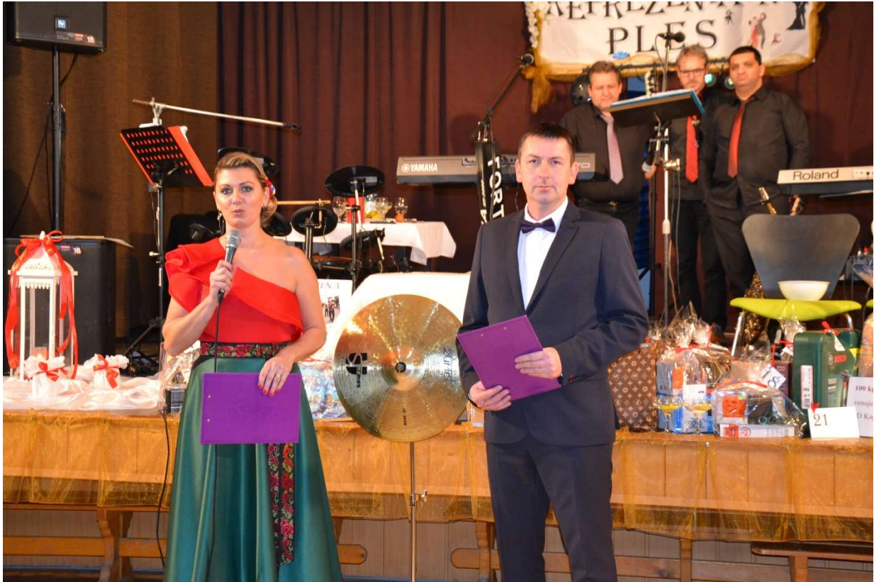
Reprezentačný ples obce Kapušany a Rady rodičov pri ZŠ s MŠ

Počas plesovej sezóny sa konal reprezentačný ples, ktorého organizátorom bol obecný úrad spolu s členmi Rady rodičov pri ZŠ s MŠ.