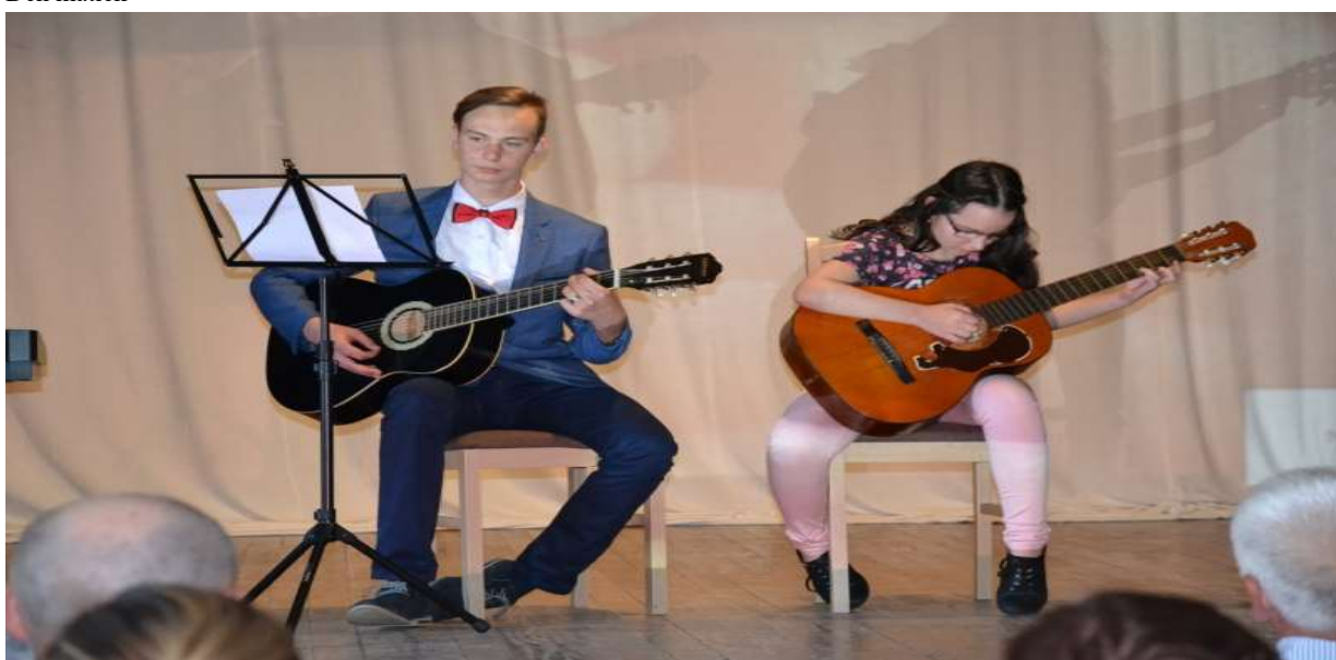
Vystúpenie detí SZUŠ počas dňa Matiek