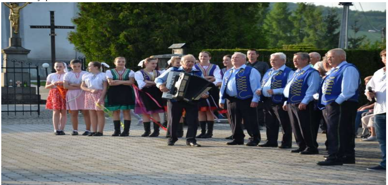
Vystúpenie MSS Kapušianske Richtaroše počas akcie Stavanie mája