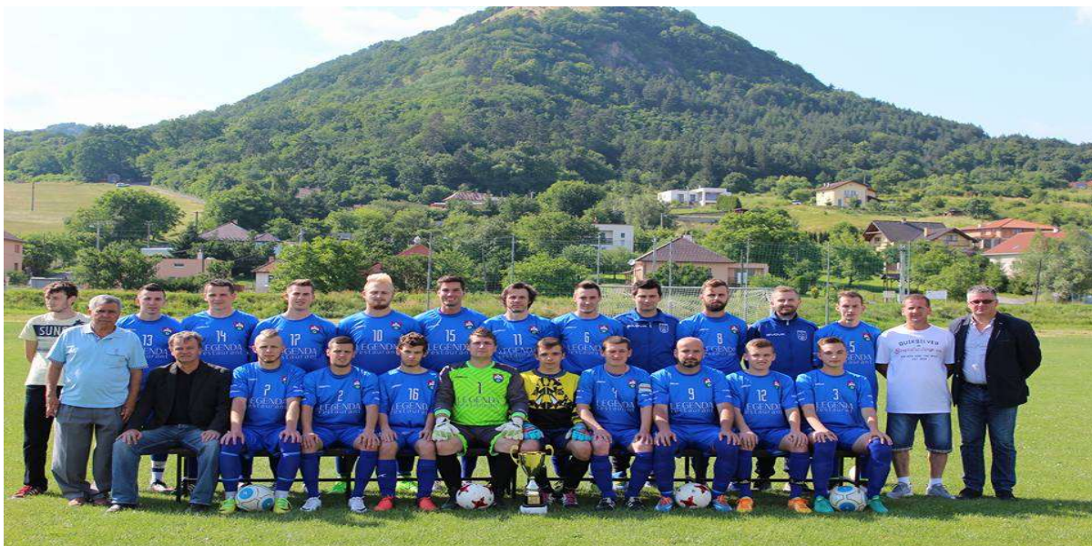
A mužstvo OŠK Kapušany