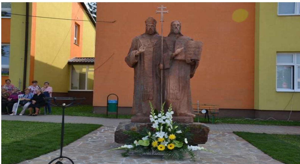
Súsošie sv. Cyrila a Metoda