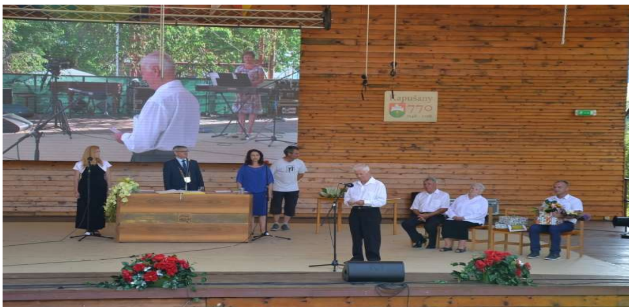
Udelenie Ceny obce Kapušany