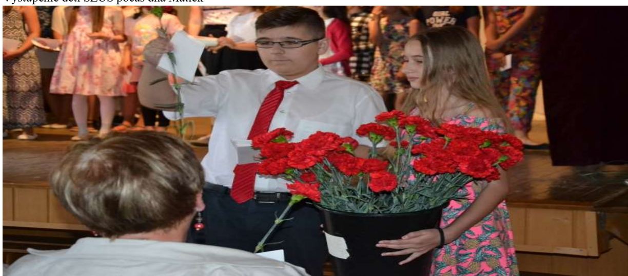
Odovzdávanie darčiekov pre mamičky

Dňa 2. júna 2018 počas akcie Deň detí v dopoludňajších hodinách sa Park sv. Cyrila a Metoda premenil na výcvikové stredisko integrovaného záchranného systému. Mladí zdravotníci, hasiči