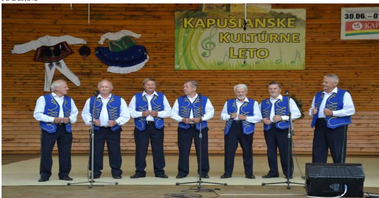
MSS Kapušianske richtaroše