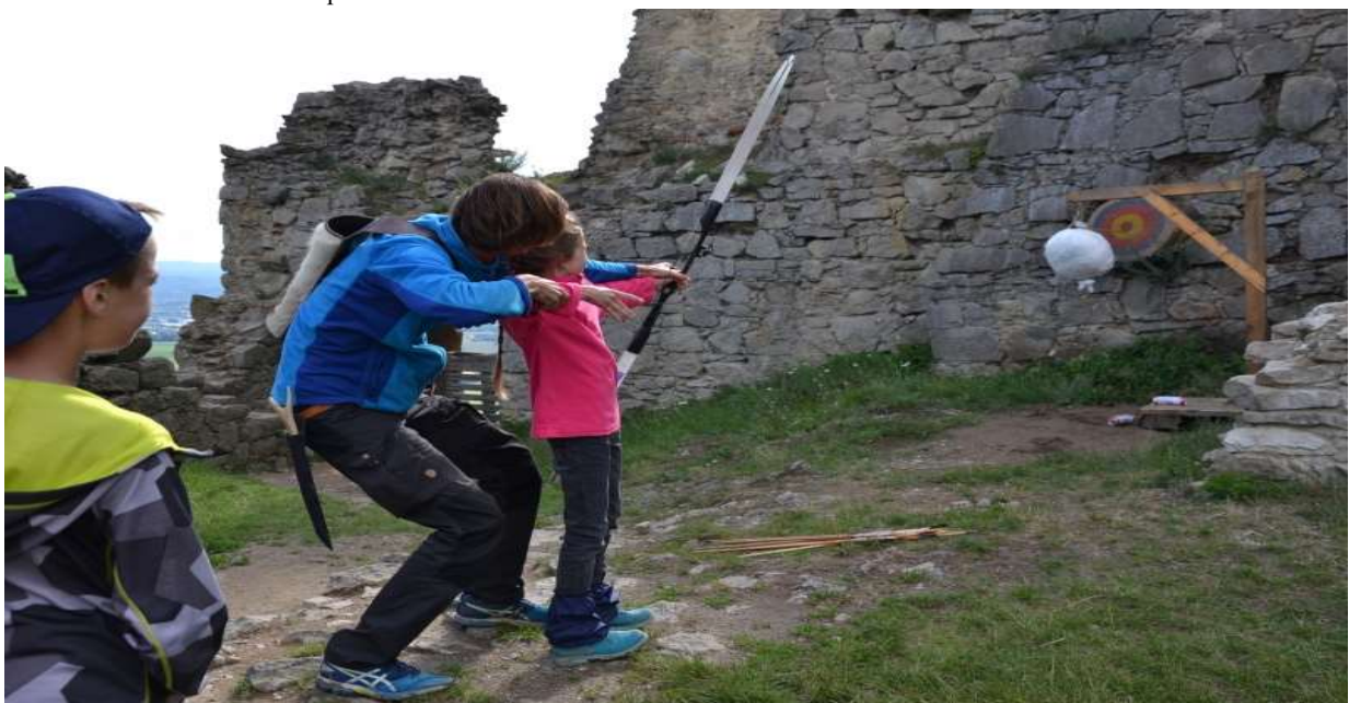
Otvorenie hradného leta na Kapušianskom hrade