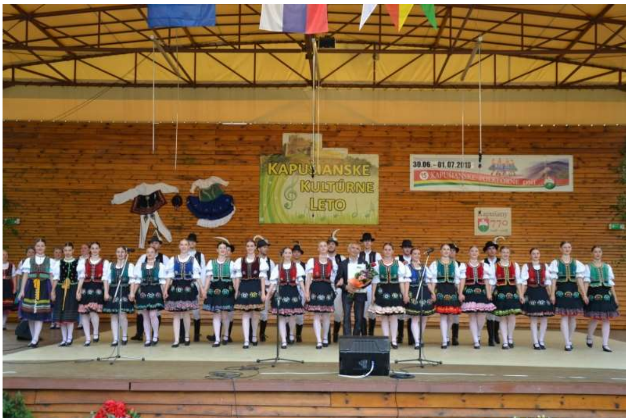
Kapušíanske folklórne dni 2018 - FS Železiar

Dňa 1.1.2018 obec otvorila denné centrum po zániku denného stacionára k 31.12.2017. Klienti denného centra si spríjemňujú pobyt rôznymi akciami, a to pečenie šišiek počas fašiangov, veľkonočná a vianočná burza a iné.