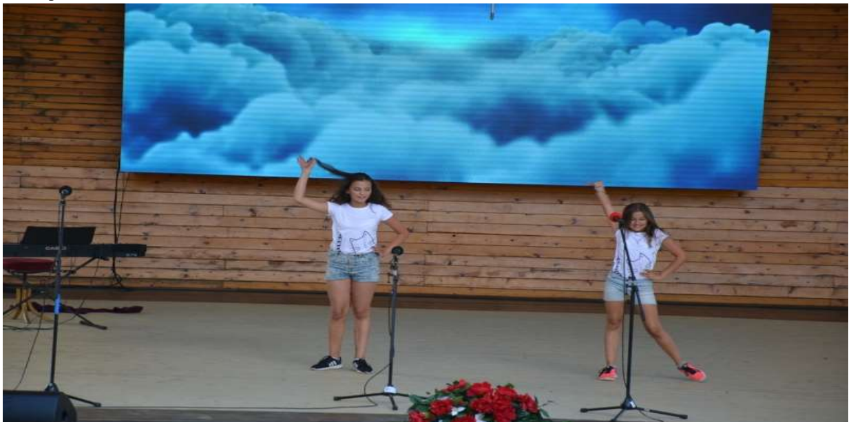
Vystúpenie Mladé talenty