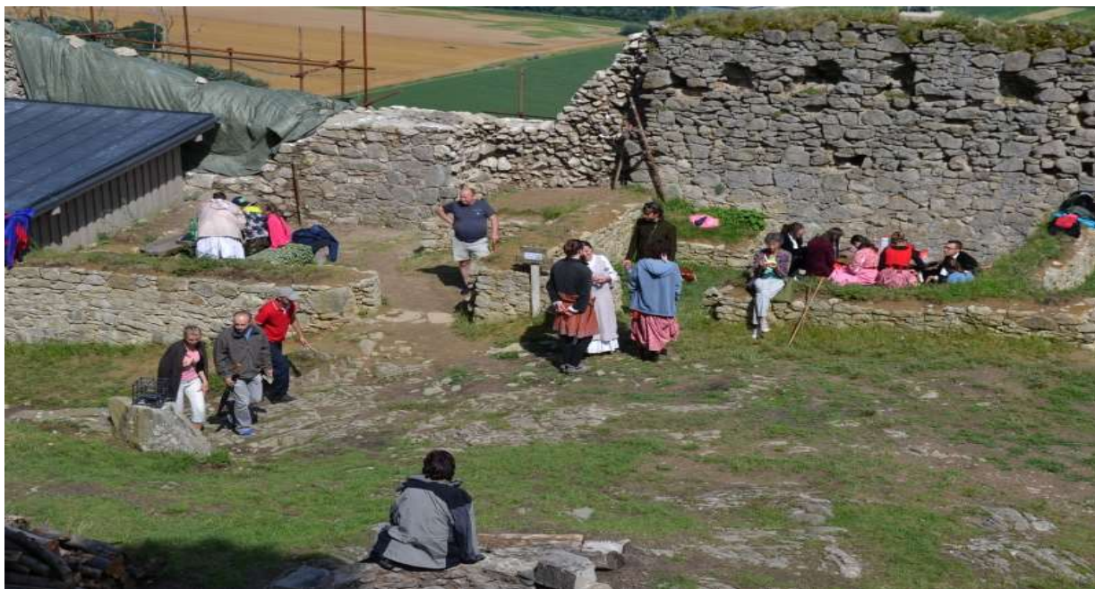
Otvorenie hradného leta na Kapušíanskom hrade.

Kapušíanske hradné leto sa uskutočnilo počas letných prázdnin na Kapušíanskom hrade. Dňa 24. júna 2018 sme hradné leto otvorili podujatím, na ktorom predviedli svoje umenie šarišskí šermiari SARUS, tanečnice historického a orientálneho tanca Fatima a herci divadla Na doske. Sprievodnými akciami boli tvorivé dielne pre deti, lukostreľba, Divadlo z kuchyne.