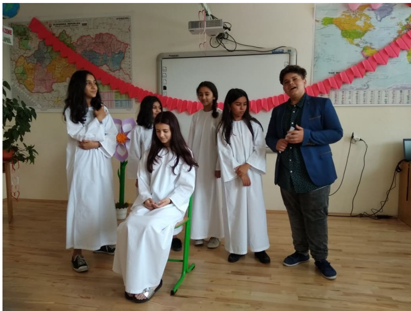
Obrázok č. 1 Deň matiek

obrany, hudobné - Rómsky talent, Vianočná akadémia, Deň matiek, výtvarné súťaže a recitácie - Hviezdoslavov Kubín, Hovoríme o jedle, Spoločné stravovanie, Medzinárodný deň detí, Svetový deň mlieka, školské výlety - Jasovská jaskyňa - Zoo Košice, Najkrajší betlehem, Florbalové turnaje, Futbalové turnaje, Prezentácie k významným historickým dňom a udalostiam. V ZŠ je 7 tried. Priemerný počet žiakov v jednej triede je 13,1. Prepočítaný priemerný počet zamestnancov v škole bol 15, pričom 10 zamestnancov bolo pedagogických a 5 zamestnanci boli nepedagogickí. Počet fyzických osôb bol 15.