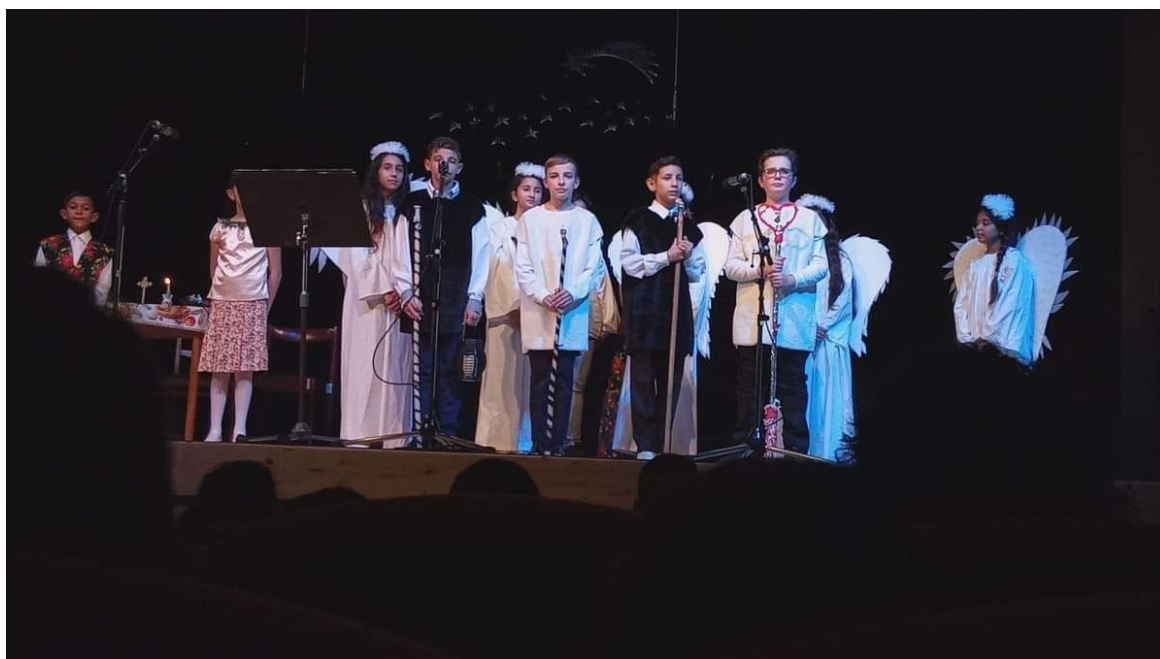
Obrázok č. 2 Vianočná akadémia