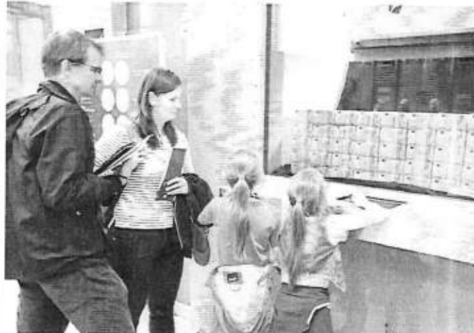
Banky potrebujú kapitál napríklad aj na financovanie úverov domácnostiam.