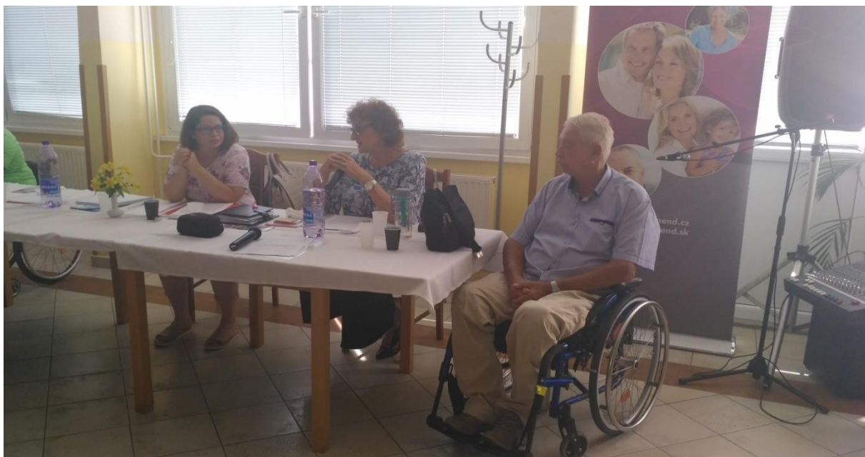
Pohľad na predsednícky stôl na Celoslovenskom seminári v Nitre