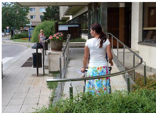
Bezbariérový vchod na Mestský úrad v Nitre

Organizácia, čo sa týka bariér postupuje razantne. Vytvorili sme sieť komisií na územných celkoch. Aj keď komisie nemajú právnu subjektivitu, právu na oslovenie a podanie sťažnosti majú. Členovia Rady o.i. o tejto oblasti na každom zasadnutí predkladajú návrhy na riešenie debariérizácie daného stavu vo svojich regiónoch, preto opäť v tejto oblasti musím vyzdvihnúť prácu celej Rady organizácie.