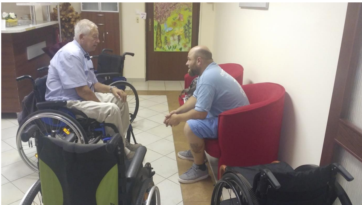
Firma Otto Bock