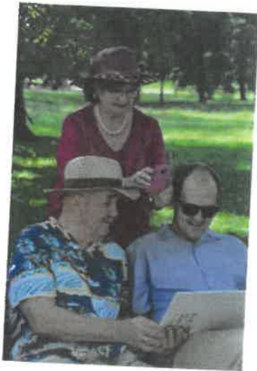
Kultúrne leto „Maľujeme v parku“, Júl 2019