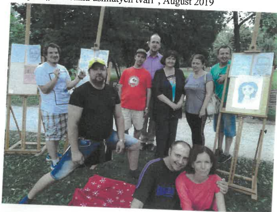
Projekt „Košičania usmiatych tvári“, August 2019