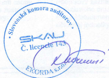
EKORDA, s.r.o. Révová 45, Bratislava Licencia SKAU 143