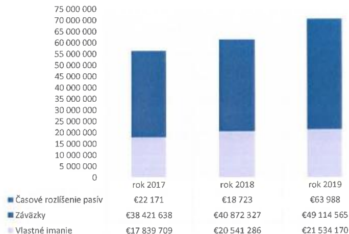
Graf č. 2: Vývoj a štruktúra pasív Spoločnosti (2017 - 2019)