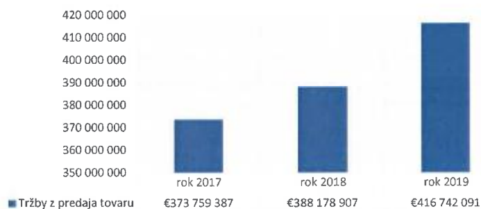
Graf č. 3: Tržby z predaja tovaru Spoločnosti (2017 - 2019)

V súvislosti so zvýšeným objemom predaja sledujeme nárast nákladov na predaný tovar a v konečnom dôsledku aj nárast obchodnej marže o 7,22 %, ktorá v bežnom účtovnom období predstavuje výšku 35 536 091 EUR.