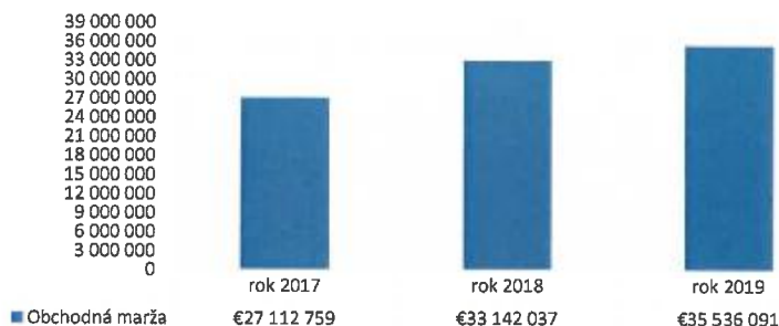
Graf č. 4: Obchodná marža Spoločnosti (2017 - 2019)

Výsledok hospodárenia po zdanení v porovnaní s predchádzajúcim obdobím vzrástol o 13,21 % (991 308 EUR).