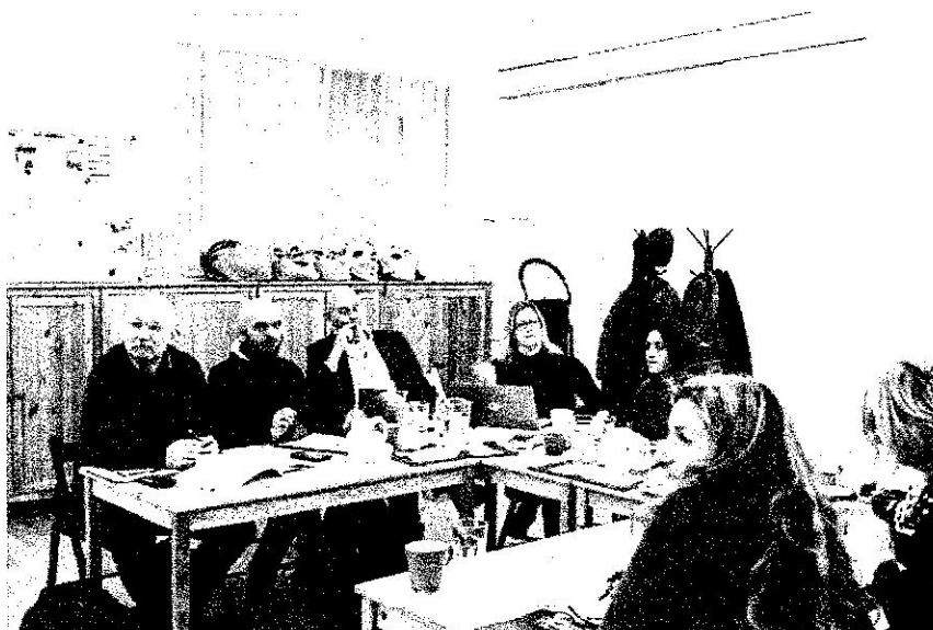
Prvé stretnutie v rámci nadnárodného projektu Spoločne za systémové zmeny v trestnej justícii v Prahe