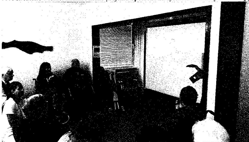
Aktivita pre seniorov – Poznávanie Arménska