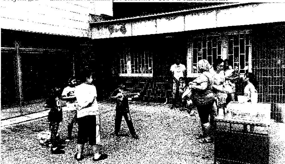
Letné športové hry pre deti zo sociálne slabšieho prostredia