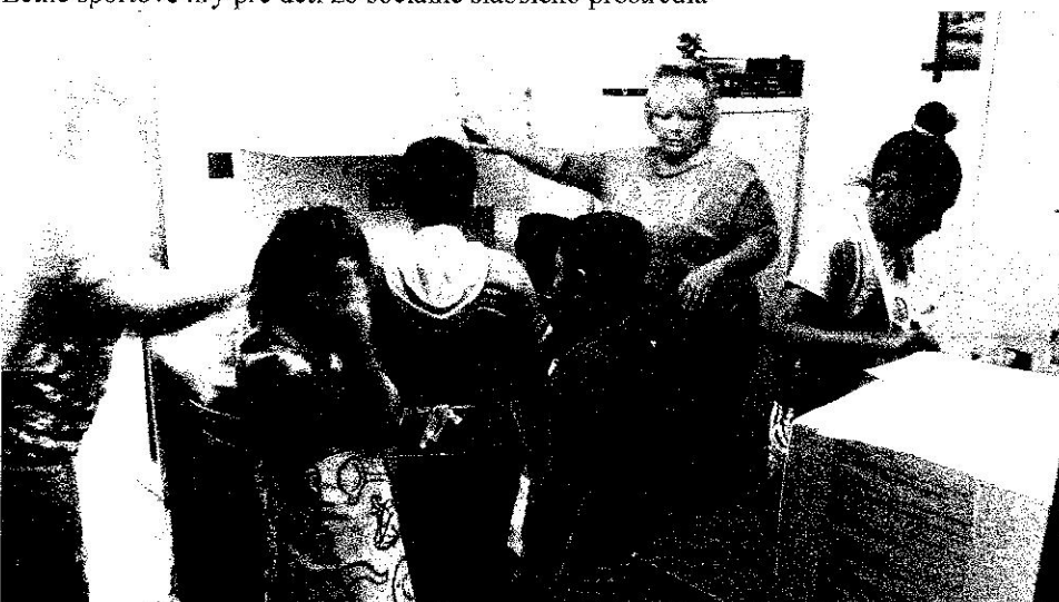
Pečenie lievancov v komunitnom centre