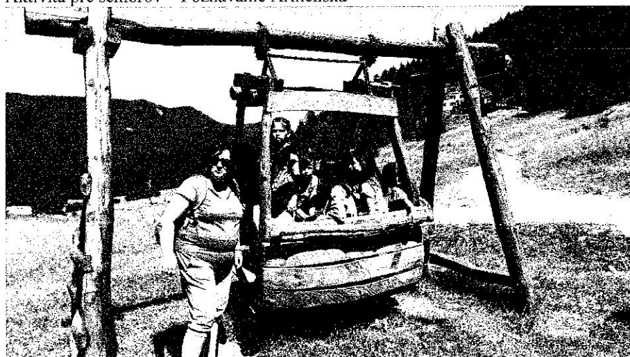
Výlet na Malinô Brdo