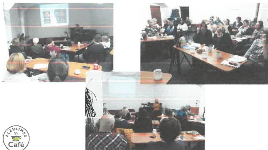
Obr. 6 Alzheimer Café Košice – neformálne stretnutia podporných skupín