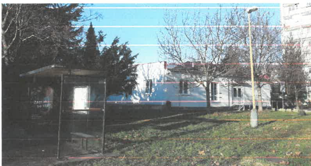
Obr. 1 Diakonické centrum Cesta nádeje - pohľad od zastávky MHD

Diakonické centrum Cesta nádeje bude od roku 2020 prevádzkované ako špecializované zariadenie v ambulantnej forme a bude poskytovať sociálne služby pre ľudí s demenciou, Alzheimerovou chorobou, Parkinsonovou chorobou a organickým psychosyndrómom (Obr. 1 až Obr. 5).