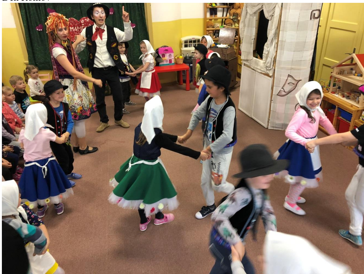
Divadlo Theatrum Návrat Pesničkála máj 2019