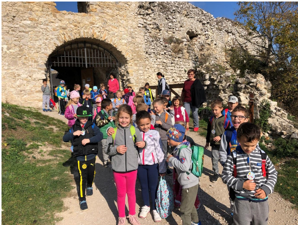
Turistická vychádzka na hrad október 2019