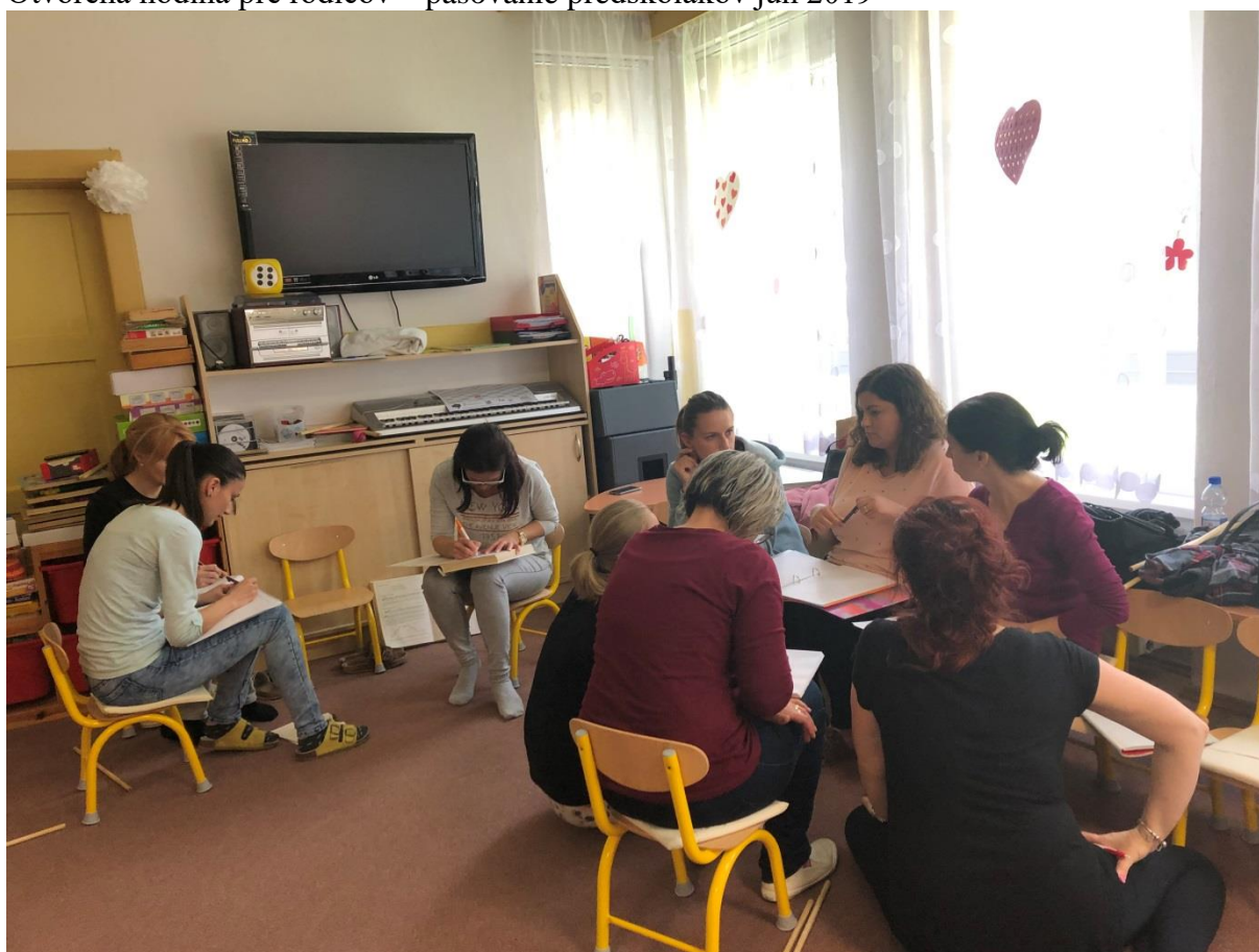
Organizovanie vzdelávania pre učiteľky MŠ - Inšpirácia vzdelávanie folklór máj 2019