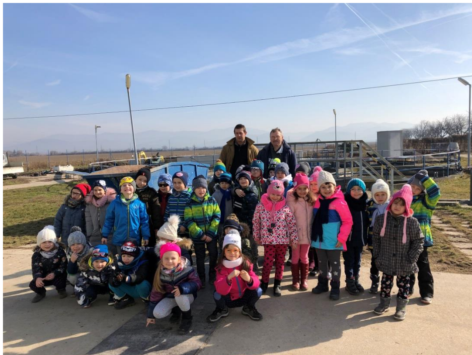
Cesta vody v prírode