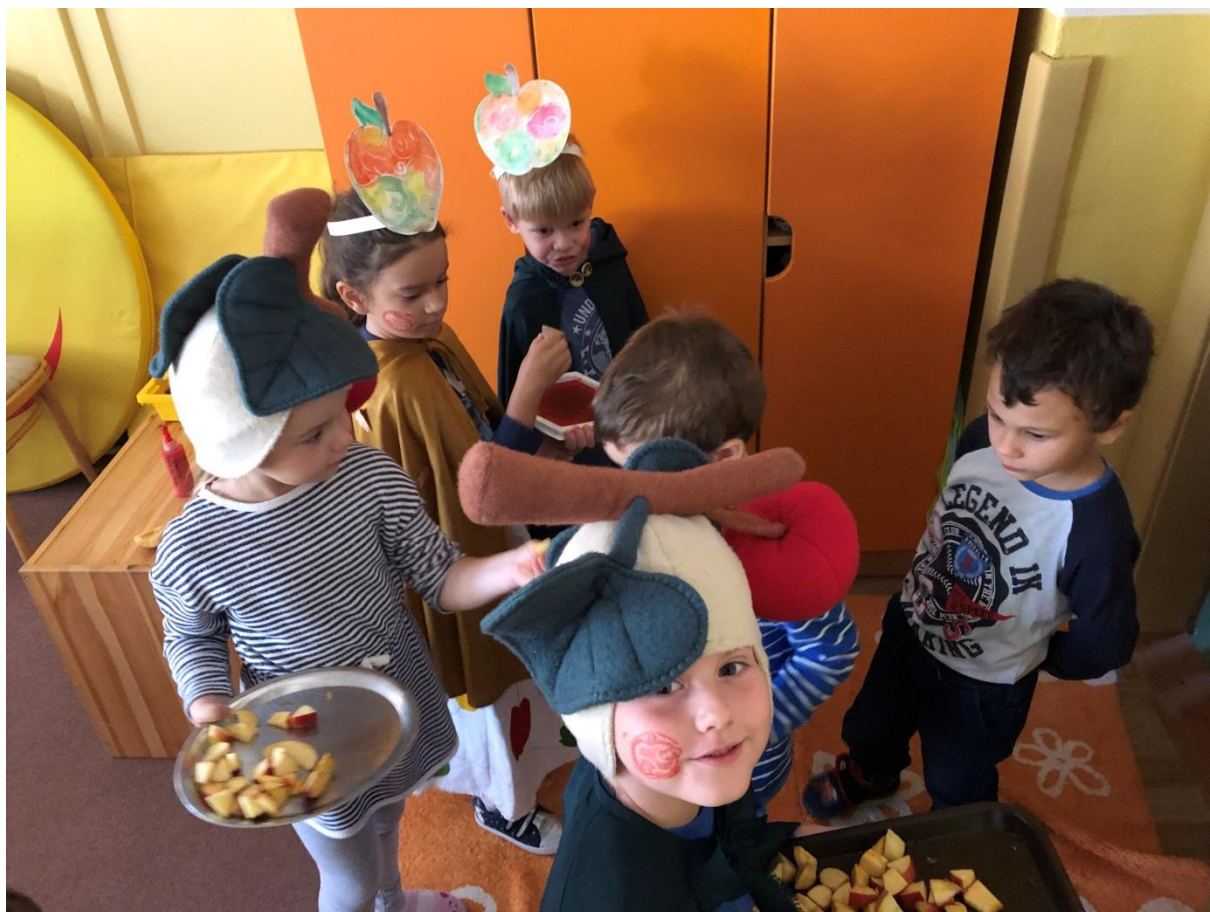
Deň jablka oktober 2019