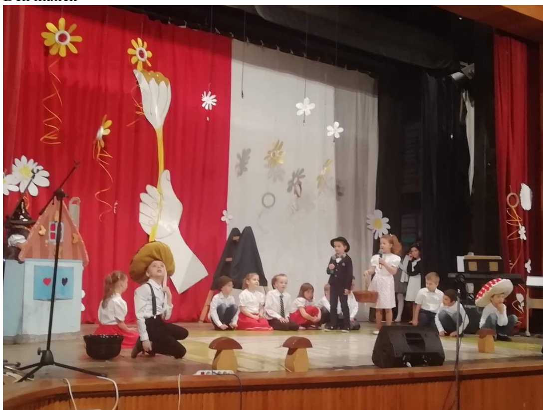
Deň matiek v kultúrnom dome