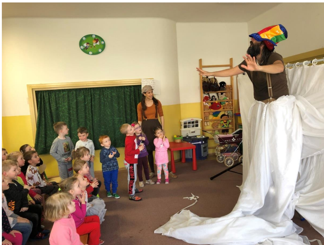
Divadlo Na traky Ako namaľovať dúhu marec 2019