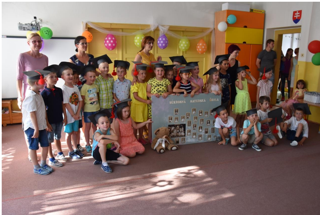
Otvorená hodina pre rodičov – pasovanie predškolákov jún 2019