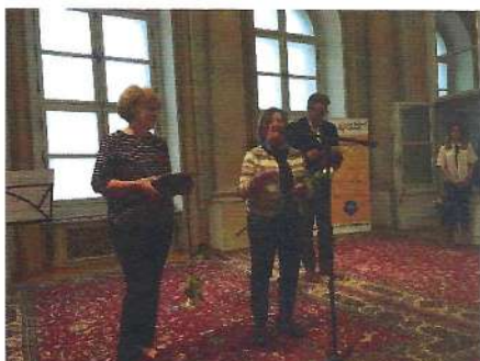
Klub s hosťom

Ocenenie Ligy za duševné zdravie za prínos v oblasti za duševné zdravie