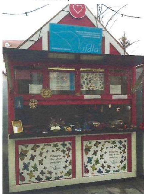
Pozvánka na vernisáž výstavy „Na krídlach fantázie“