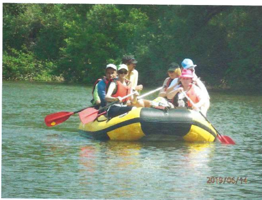
Športový deň spojený so splavom