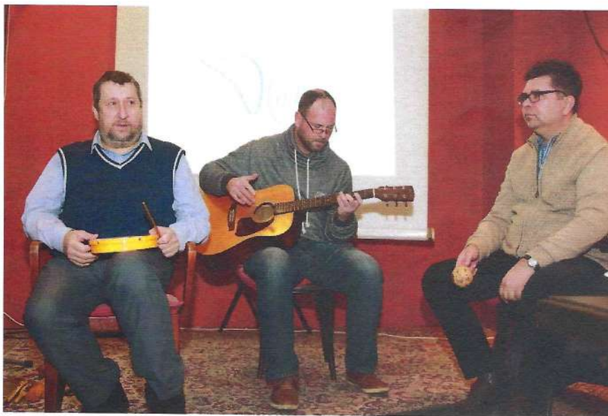
Vianočný večierok 2019