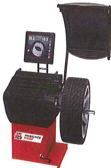
Vyvažovačka kolies Probalance