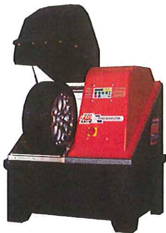
Umývačka Turbo Wasch 2700