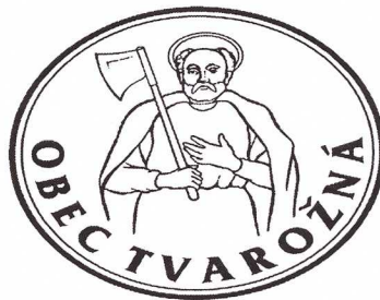
OBR. Č. 4: PEČAŤ OBCE TVAROŽNÁ

V pečati sa vyskytuje horná časť postavy svätého Mateja odetého v plášti, s gloriolou okolo hlavy, ako drží v pravej ruke sekeru opretú o plece.