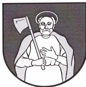
Obr. č. 2: Erb obce Tvarožná

Svätý Matej apoštol je patrónom farského rímskokatolíckeho kostola.