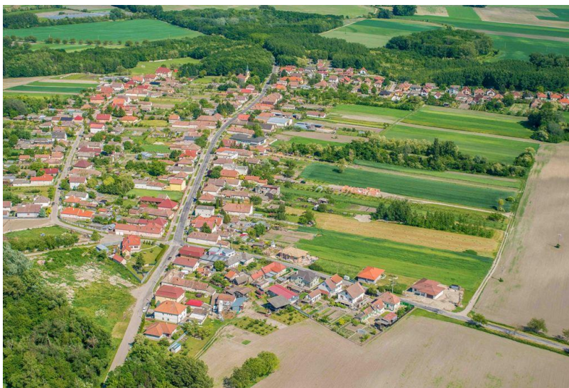
Letecká snímka intravilánu obce z vtáčej perspektívy