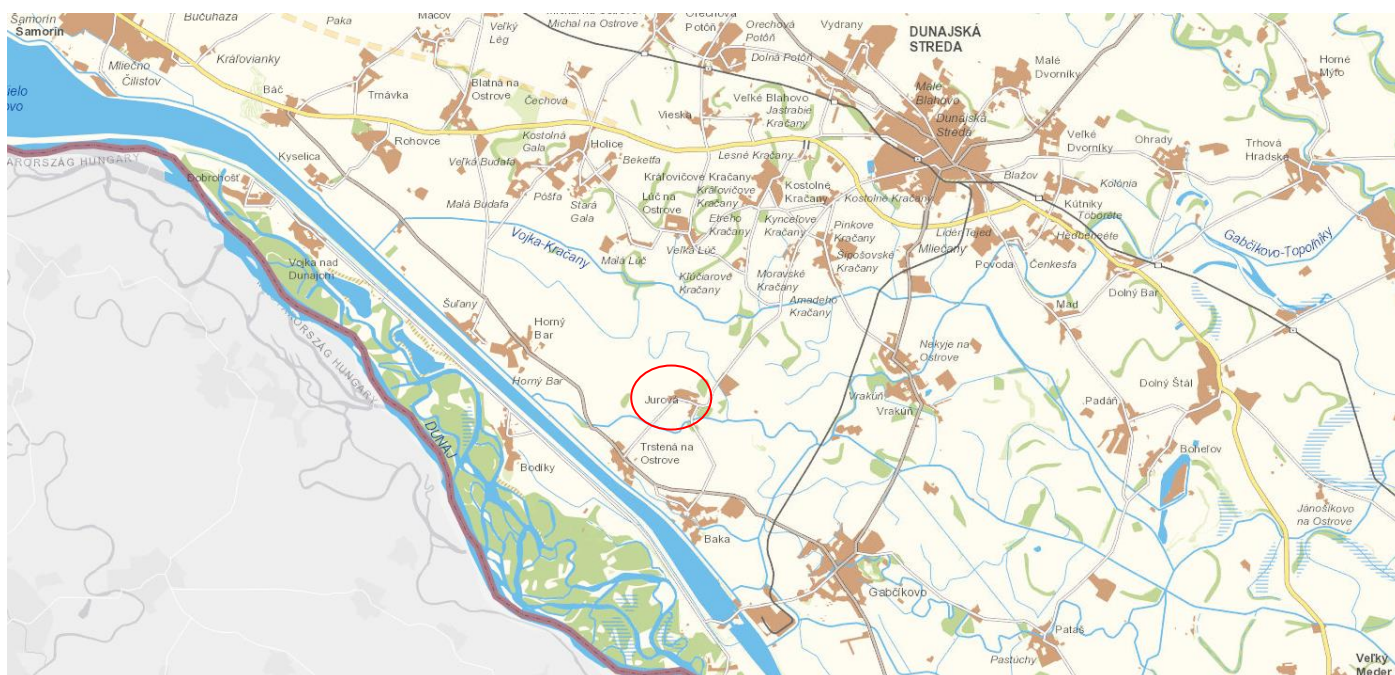
Mapa: Poloha obce Jurová na Slovensku vo vzťahu k hlavnému mestu, krajskému centru a okresnému mestu