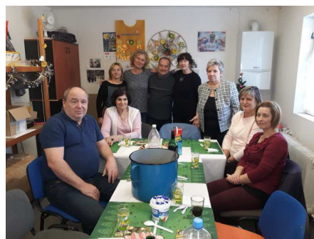
Stretnutia ZP klientov Centra a ZP pracovníkov CH.D. KRUH n.o .pri grilovačke alebo kapustnici.