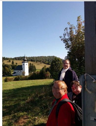
Výlet ZP klient do Budatína a okolia