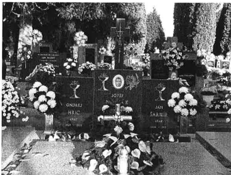
Hrob Jozefa Nováka na čajkovskom cintoríne