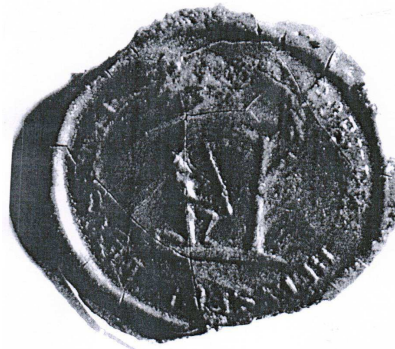
Pečať z 19. storočia

Na pečati s kruhopisom PORUBKA HELYSÉGE PETSÉTYE (Pečať obce Porúbka) je vyobrazený na pôde strom a vedľa neho kľáčiaca mužská postava v klobúku, v oboch rukách držiaca sekeru.