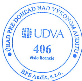
Zodpovedný audítor Mgr. Peter Šebest Licencia SKAU č. 960

BPS Audit, s. r. o. Licencia UDVA č. 406