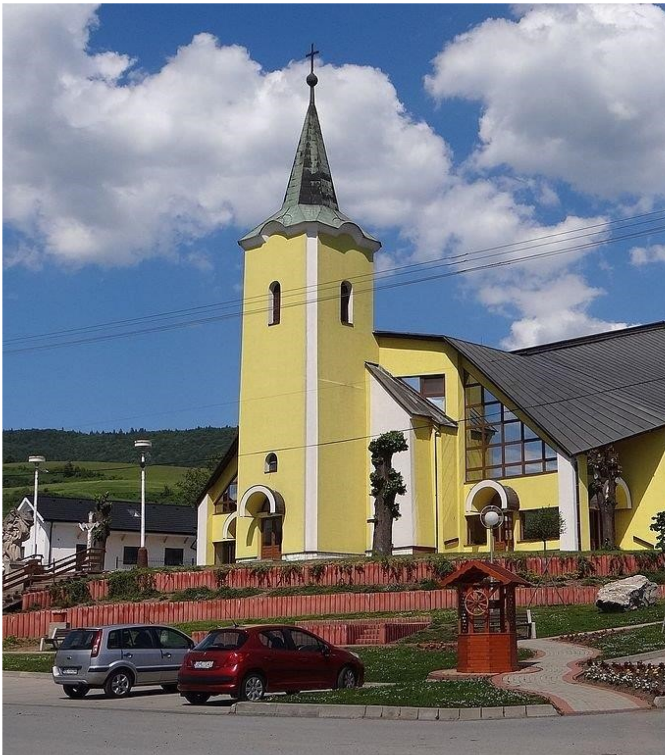
Pohľad na kostol Všetkých svätých