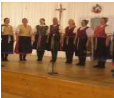
Fašiangy s folklórom