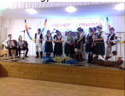
Fašiangy s folklórom