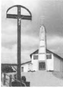
Kostol sv. Cyrila a Metoda v Rakovej – Korcháni z roku 1991