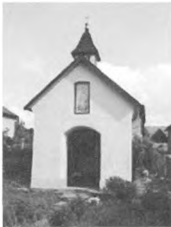
Kaplnka u Matuška