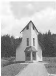
Kaplnka v miestnej časti u Blažička z roku 2002