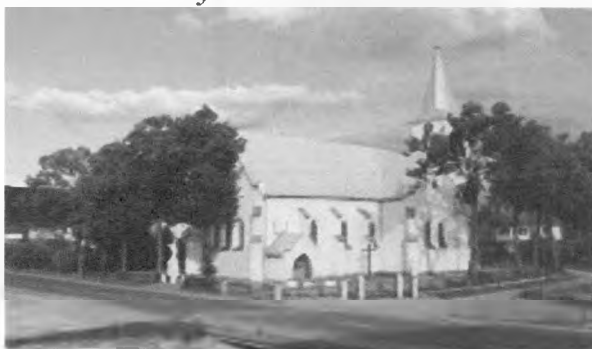
Rímsko-katolícky kostol Narodenia Panny Márie z roku 1874