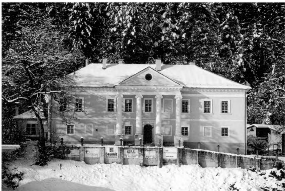
Kaštieľ v Lietavskej Lúčke