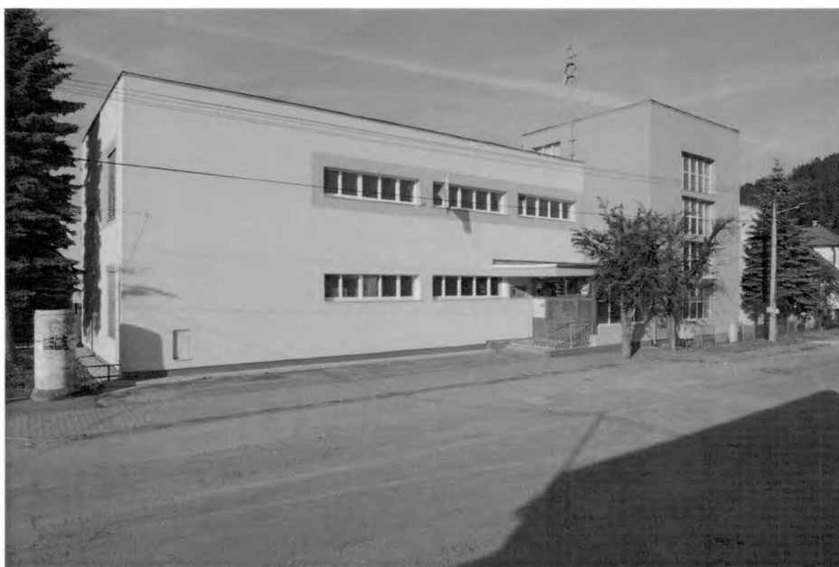
Budova ZŠ 1-4

Budova ZŠ 5-9 prešla rozsiahlou rekonštrukciou v rokoch 2008-2009, ktorej výsledkom je moderná nízkoenergetická stavba. V roku 2015 bolo pri Základnej škole 5-9 vybudované nové multifunkčné futbalové ihrisko financované dotáciou z Úradu vlády SR a obcou. V roku 2019 bola v rámci projektu cezhraničnej spolupráce s názvom „spoločný pohyb a komunikácia namiesto počítača“ dokončená výstavba ďalšieho multifunkčného ihriska na nádvorí ZŠ. Ihrisko je určené na ostatné loptové hry /florbal, vybíjaná, basketbal, hádzaná/. Budova ZŠ 1-4 bola rekonštruovaná v roku 2015. Bol zateplený obvodový plášť a strecha budovy.