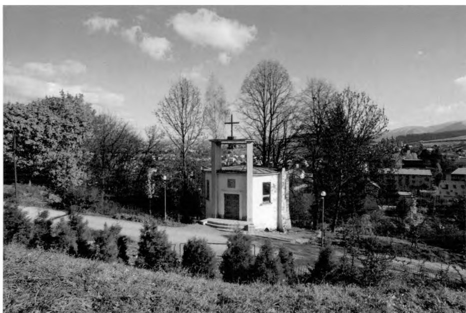
Kaplnka svätého Jozefa Robotníka