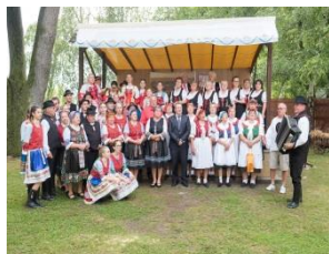
Vystúpenie speváckych skupín z radov dôchodcov z okolitých dedín

V priestoroch dvora obecného úradu sa uskutočnilo vystúpenie speváckych skupín z členov dôchodcov okolitých obcí. V obecnom kaštieli to bolo vystúpenie Terchovskej ľudovej muziky „PUPOV“ a v priestoroch kúrie súp.čísla 188 prehliadka rekonštruovaných priestorov.