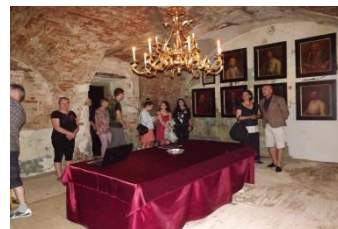
Prehliadka „malého kaštieľa“