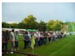
Jánsky futbalový turnaj