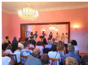
Vystúpenie terchovskej muziky „PUPOV“ v obecnom kaštieli