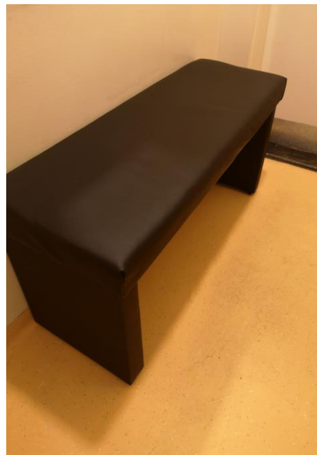
Lavice v ožarovniach