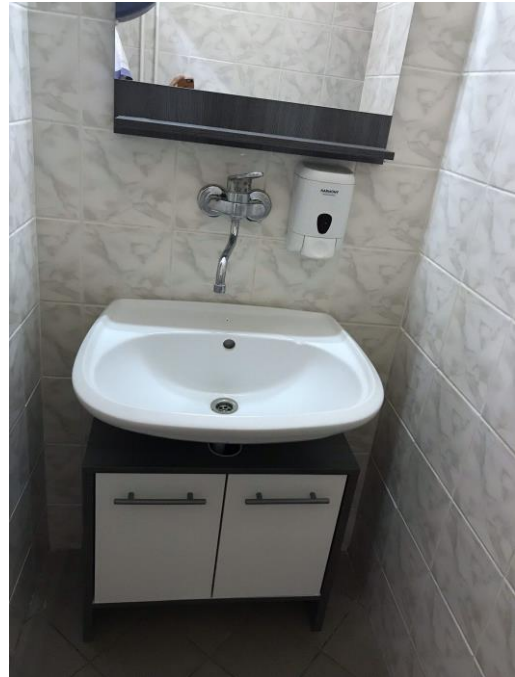
Kúpeľňové skrinky a zrkadlá

Do kabínok ožarovní sme zakúpili lavice na sedenie, čím sme prispeli k zlepšeniu pohodlia pacientov pri ich príprave na ožarovanie.