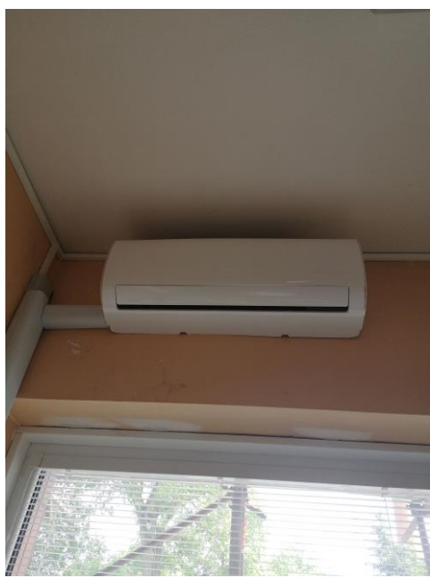
Klimatizácia v izbách v dennom stacionári

V ambulantnej časti oddelenia sme inštalovali klimatizáciu pre zlepšenie kvality vzduchu pri podávaní liečby. Pacienti, ktorí k nám prichádzajú na vyšetrenie, ale aj tí, ktorí sa k nám vracajú kôli opakovanej liečbe. Pri podávaní chemoterapie strávia na lôžku väčšinu svojho dňa, preto sa im snažíme vyhovieť a spríjemniť ovzdušie vhodne nastavenou klimatizáciou.