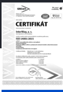
ISO 14001 systém environmentálneho manažerstva

Spoločnosť InterWay, a. s. vybudovala Integrovaný Manažerský Systém a už niekoľko rokov má zavedené certifikované systémy riadenia ISO podľa požiadaviek medzinárodných noriem.