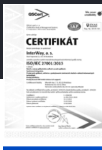
ISO / IEC 27001 systém pre ochranu informácií a budovanie kybernetickej bezpečnosti organizácií