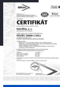
ISO / IEC 20000 systém pre riadenie IT služieb

Certifikačné partnerské úrovne poskytujú nám inakším klientom konkurenčné výhody priamej dostupnosti noviniek, komplexnú ponuku a cenové zvýhodnenia IT produktov a služieb. Počas roku 2019 sa spoločnosť zapísala do partnerstiev nasledujúcich spoločností.