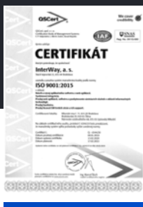
ISO 9001 systém pre vybudovanie a udržiavanie fungujúceho systému manažerstva kvality