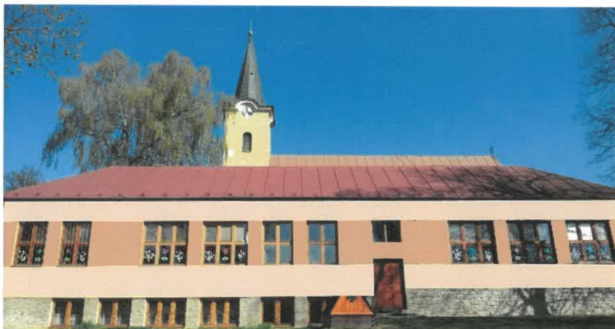
- Materská škola Iľiašovce