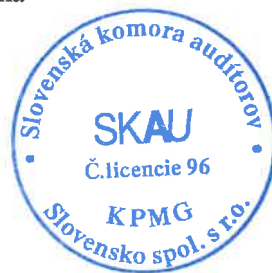
Zodpovedný audítor: Ľuboš Vančo Licencia SKAU č. 745

Audítorská spoločnosť: KPMG Slovensko spol. s r. o. Licencia SKAU č. 96