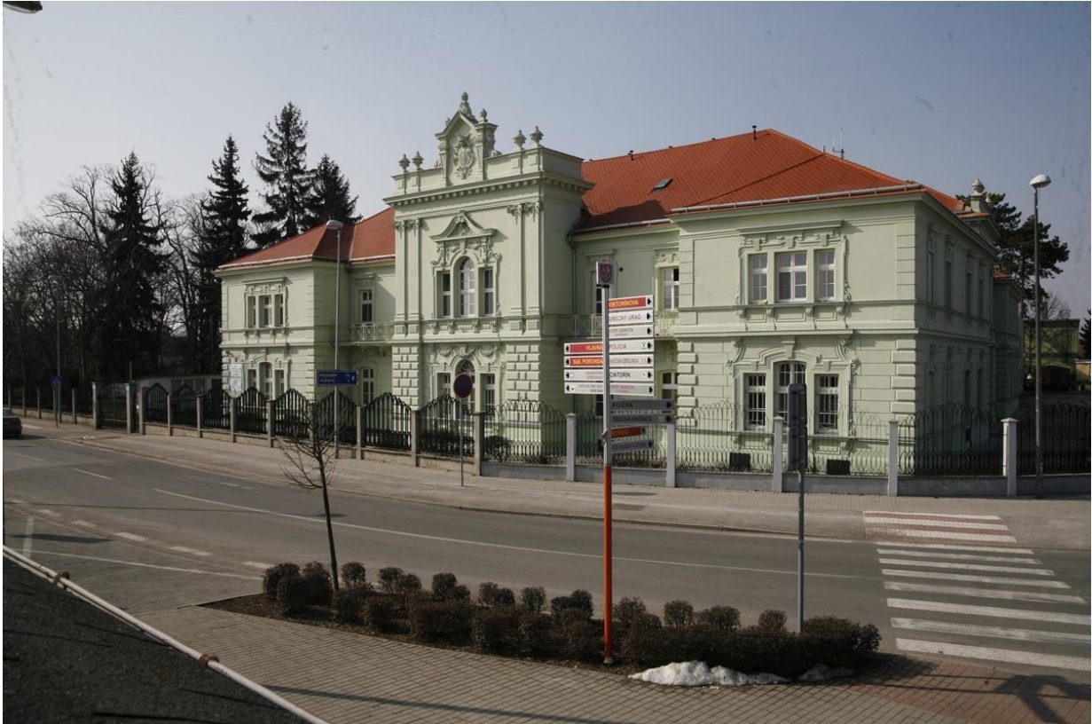
Kaštieľ rodiny Majláthovcov zo začiatku 19. storočia, dnes Domov sociálnych služieb pre duševne chorých v správe VÚC Trnava

Medzi kultúrne pamiatky patrí kaštieľ rodu Majláthovcov spolu s parkom a ohradným múrom.