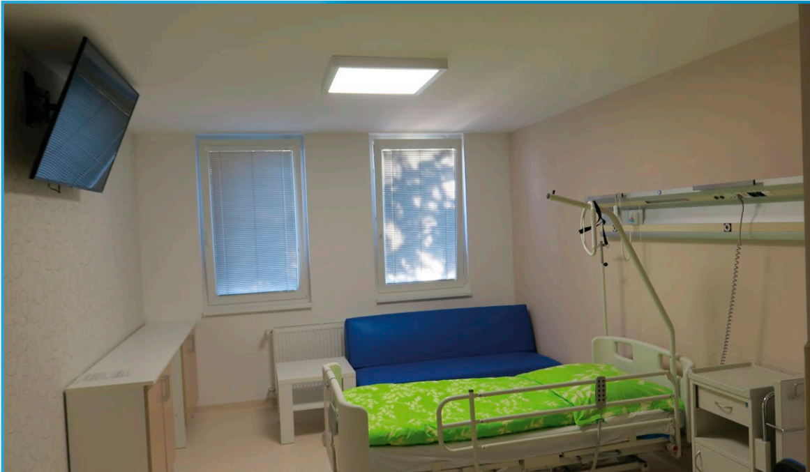
Izba pre pacientov na Oddelení vnútorného lekárstva v zrekonštruovanom Internom pavilóne