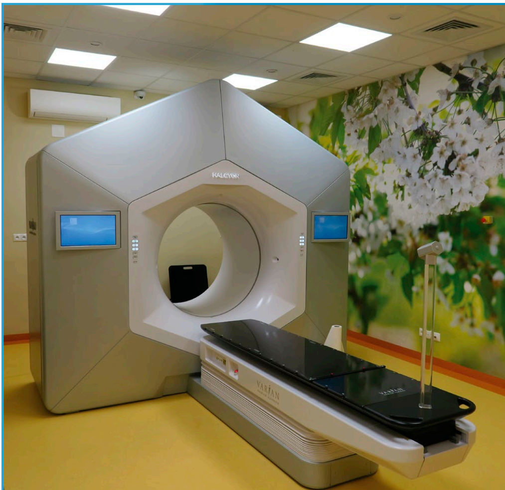
Lineárny urýchľovač HALCYON

Aj touto cestou by som rád poďakoval všetkým spolupracujúcim na tomto projekte no najmä materskej spoločnosti AGEL a. s., ktorá samotný projekt zastrešovala. Spustením projektu sa našej nemocnici otvorili nové možnosti v raste kvality a v rozširovaní spektra zdravotnej starostlivosti.