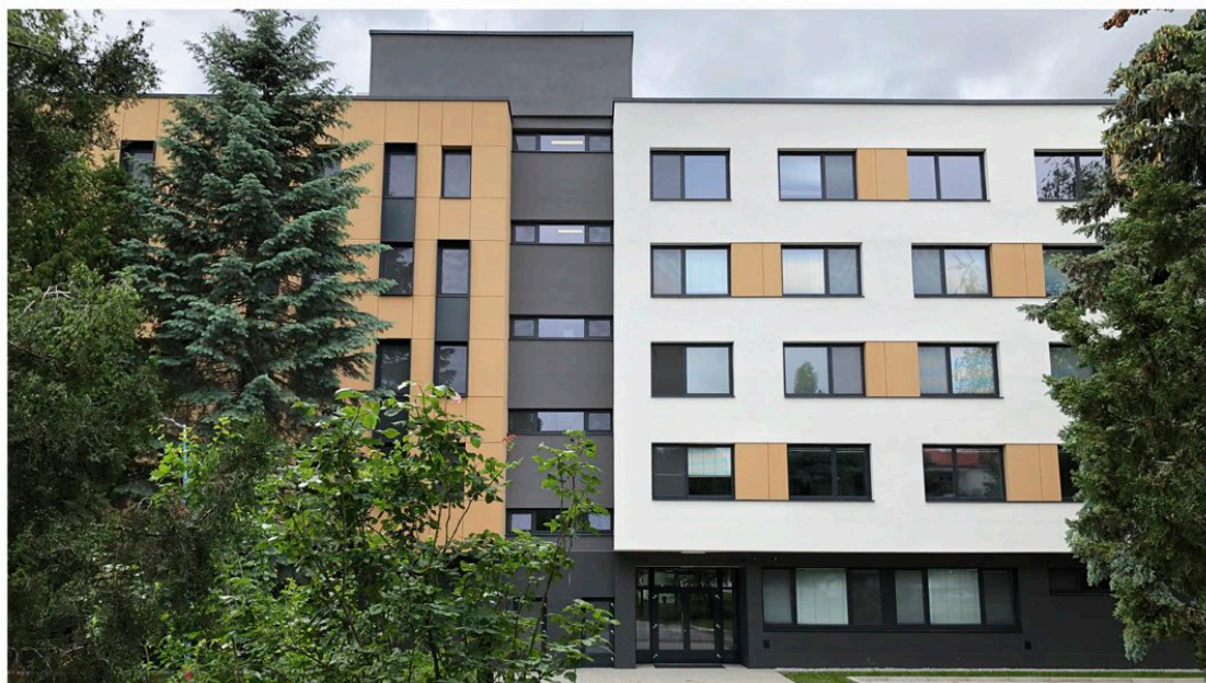
Interný pavilón pred a po rekonštrukcii