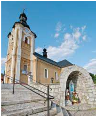
Kostol svätého Andreja