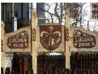
Pamätná tabuľa pri príležitosti 600 rokov od prvej zmienky