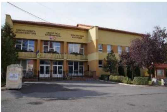
KOSTOL SV. ŠTEFANA KRÁĽA A KULTÚRNY DOM V BISKUPICIACH