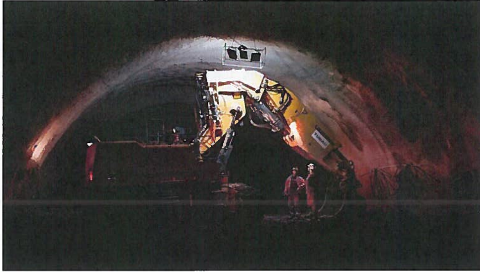
Tunel diel – Kalota tunela