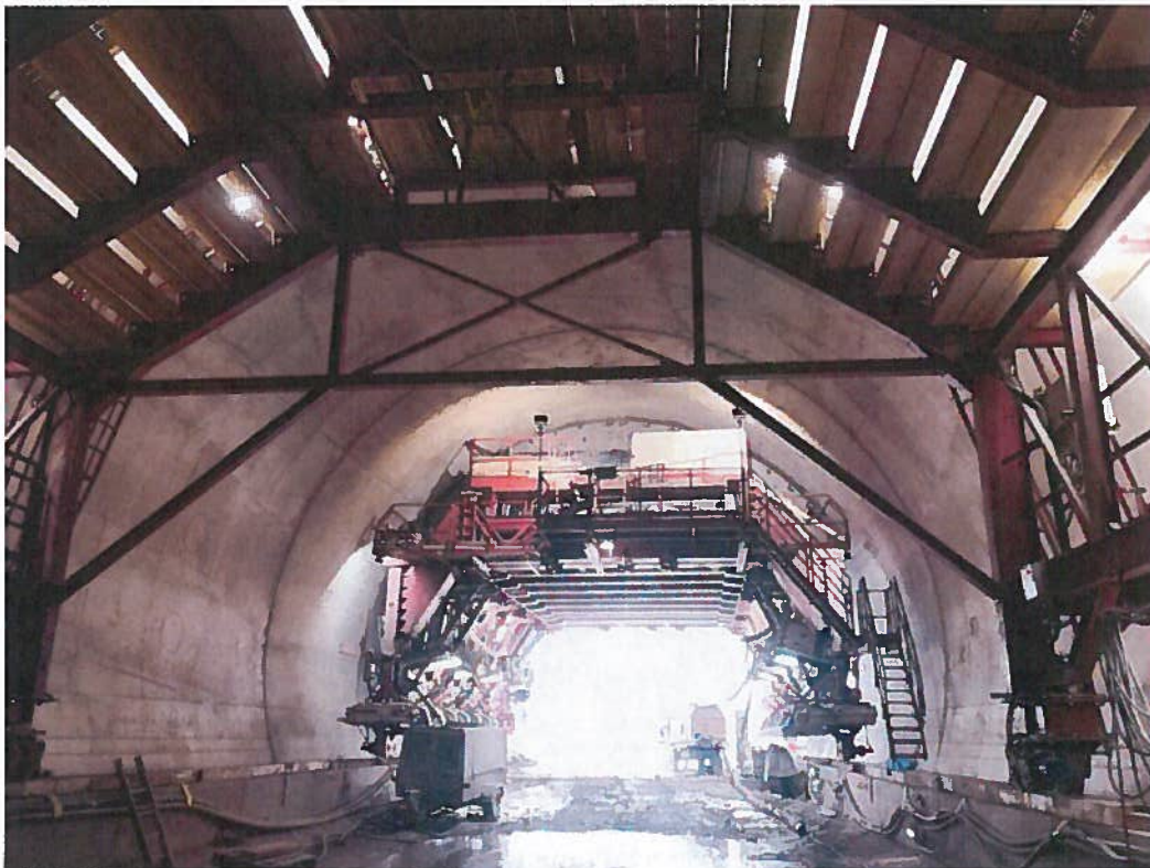
Tunel Diel – Betonáž sekundárneho ostenia tunela