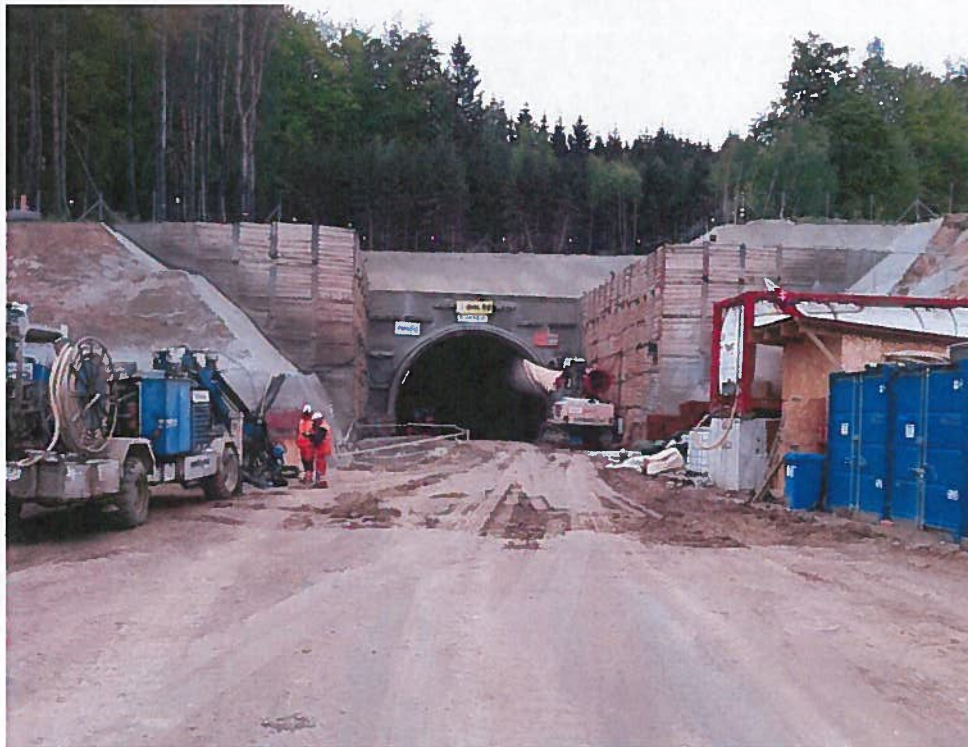
Výjazdový portál tunel Deboreč

Razená časť tunela bude realizovaná v zmysle zásad NRTM s použitím mechanického rozpojovania v priortálových oblastiach.. Tunelové ostenie je navrhnuté dvojplášťové tvorené primárnym a sekundárnym ostením.