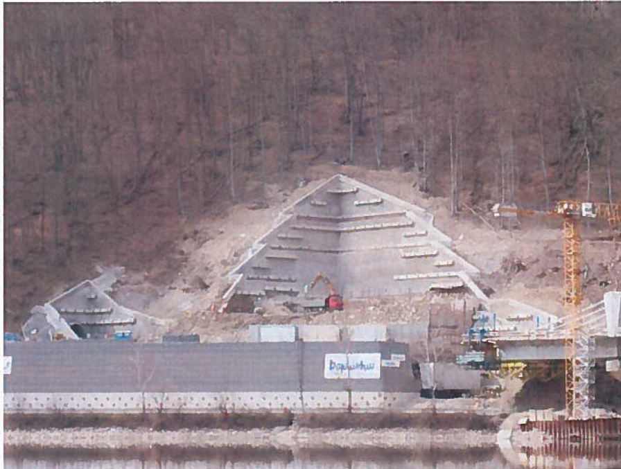
Východný portál tunela Diel

Na vybudovanie portálovej jamy bolo potrebné vytvoriť v existujúcom svahu výkop. Na zabezpečenie stability zárezu bola použitá metóda klincovania a kotvenia hornín.