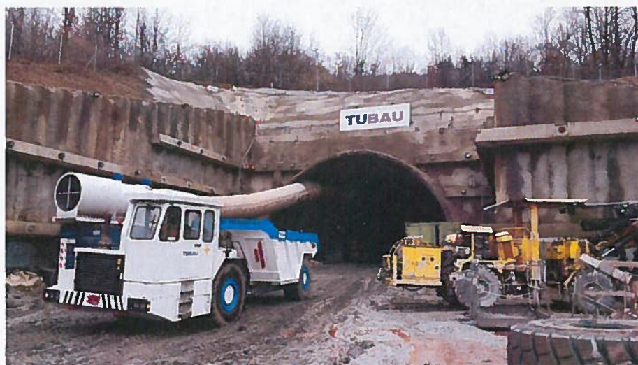
Západný portál tunela – raziace práce

Traťová rýchlosť: 160 km/h, (výhládová rýchlosť 200 km/h pre možnosť jazdy jednotiek s výkyvnými skriňami)