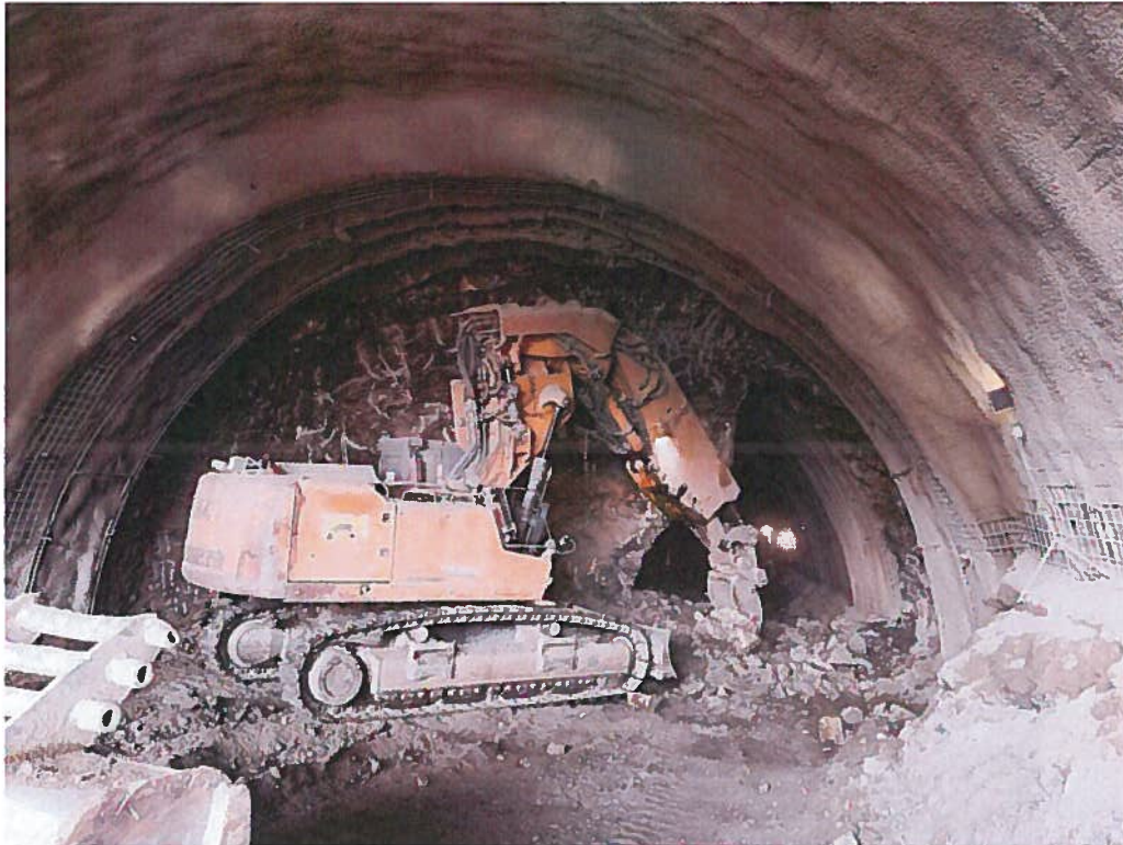
Tunel Diel – Prerážka tunela

ZŠR Trať Žilina – Púchov, Tunel Diel – Východný portál tunela