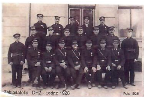
Zakladatelia DHZ - Lodno 1926