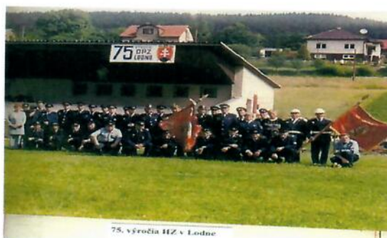
75. výročia HZ v Lodne