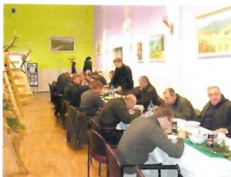
Združenie poľovníkov Kremienok