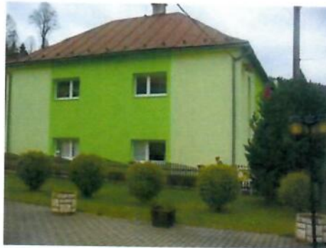
Budova obecného úradu